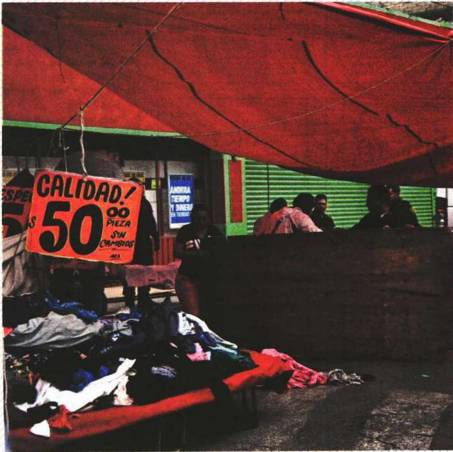
Este domingo, el ataque contra dos comerciantes en un tianguis en Iztapalapa es investigado por las autoridades judiciales.