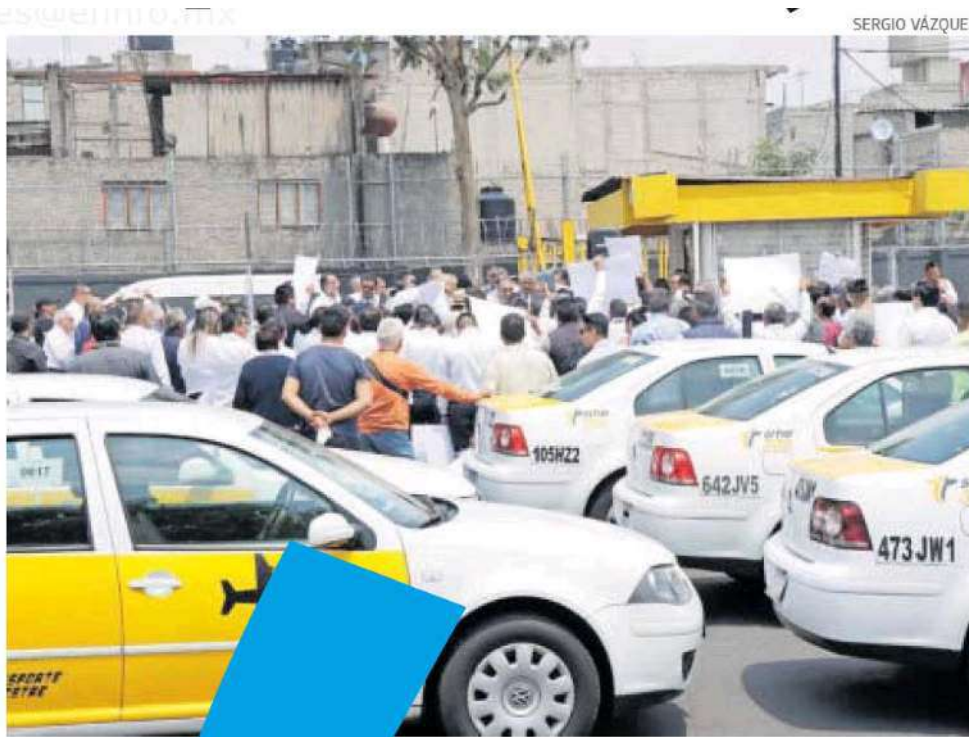
Bloqueo en los alrededores del AICM.