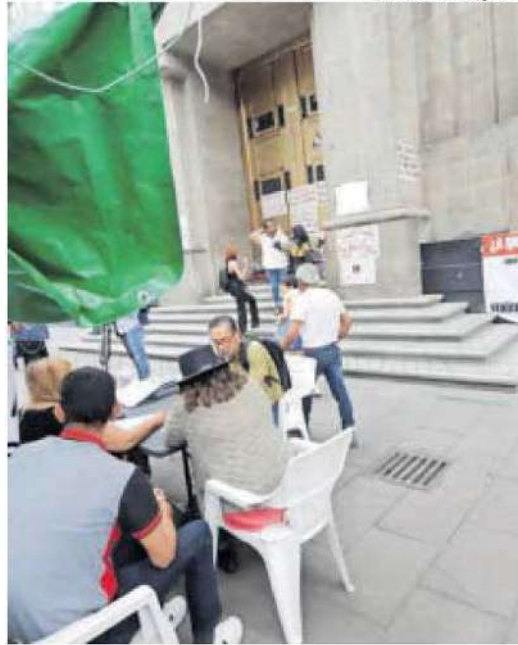
Dicen ser del pueblo