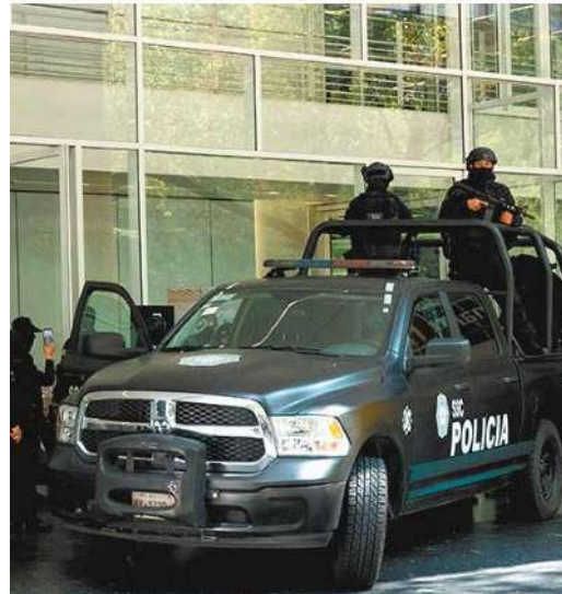
➕ Personal de la SSC en operativos en Cuauhtémoc.

Lo llamativo de la extorsión es que entre enero y febrero pasado se dio un repunte de 84.7% en las pesquisas con relación al mismo periodo del año pasado, esto al transitar de 46 a 85 casos, según cifras difundidas por el SESNSP.