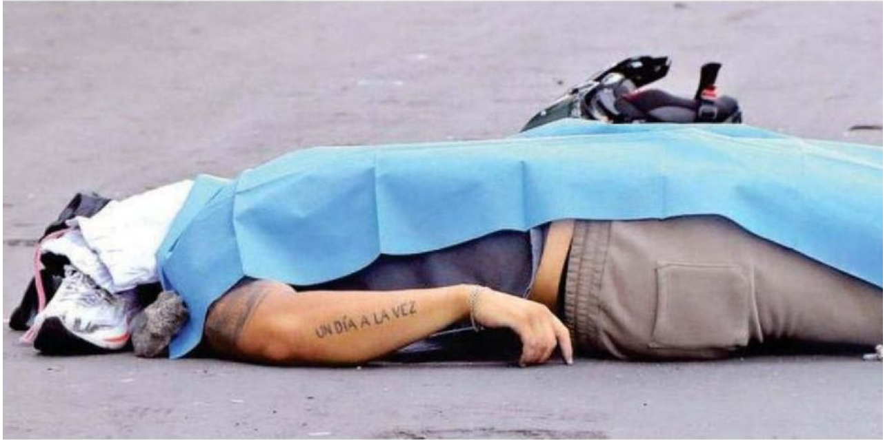
El fallecido se dirigía a una lucha en el Sindicato Mexicano de Electricistas