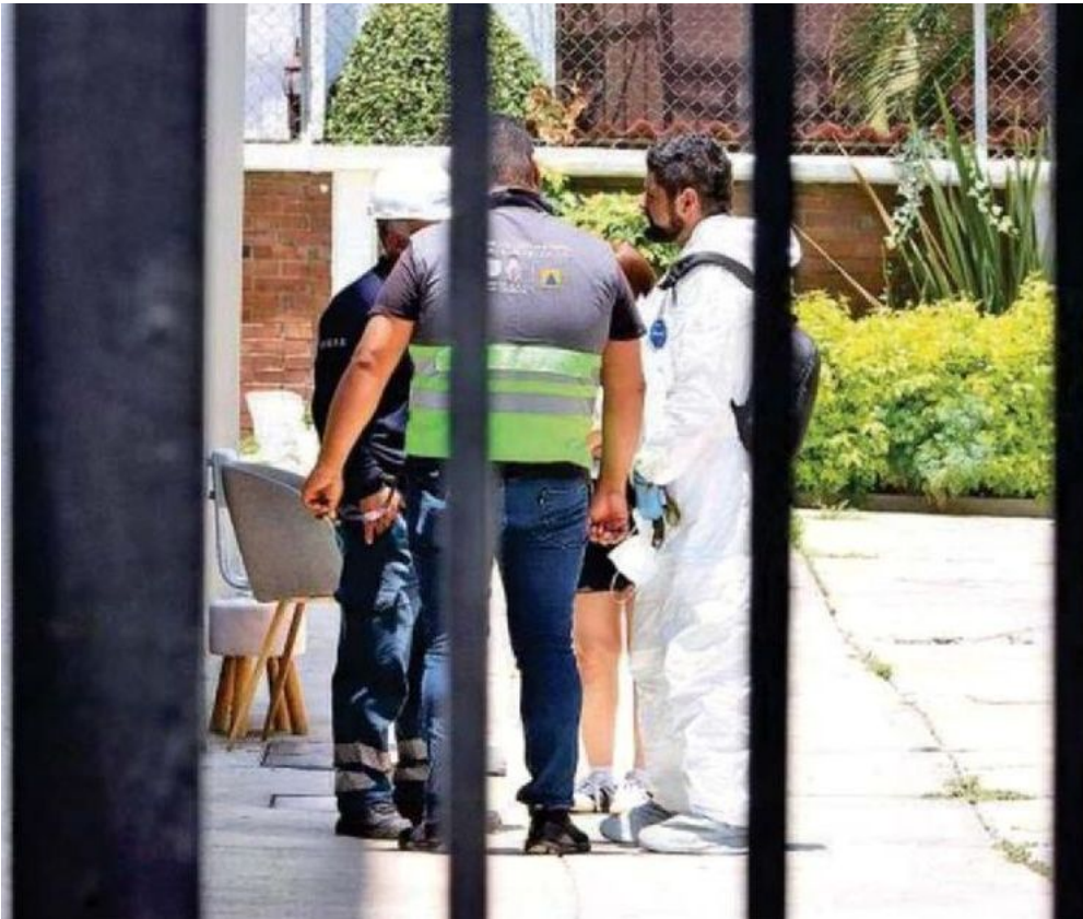
Los peritos ingresaron al conjunto habitacional para dar fe de los hechos y asentarlos en la carpeta de investigación bajo el rubro de homicidio culposo por otras causas