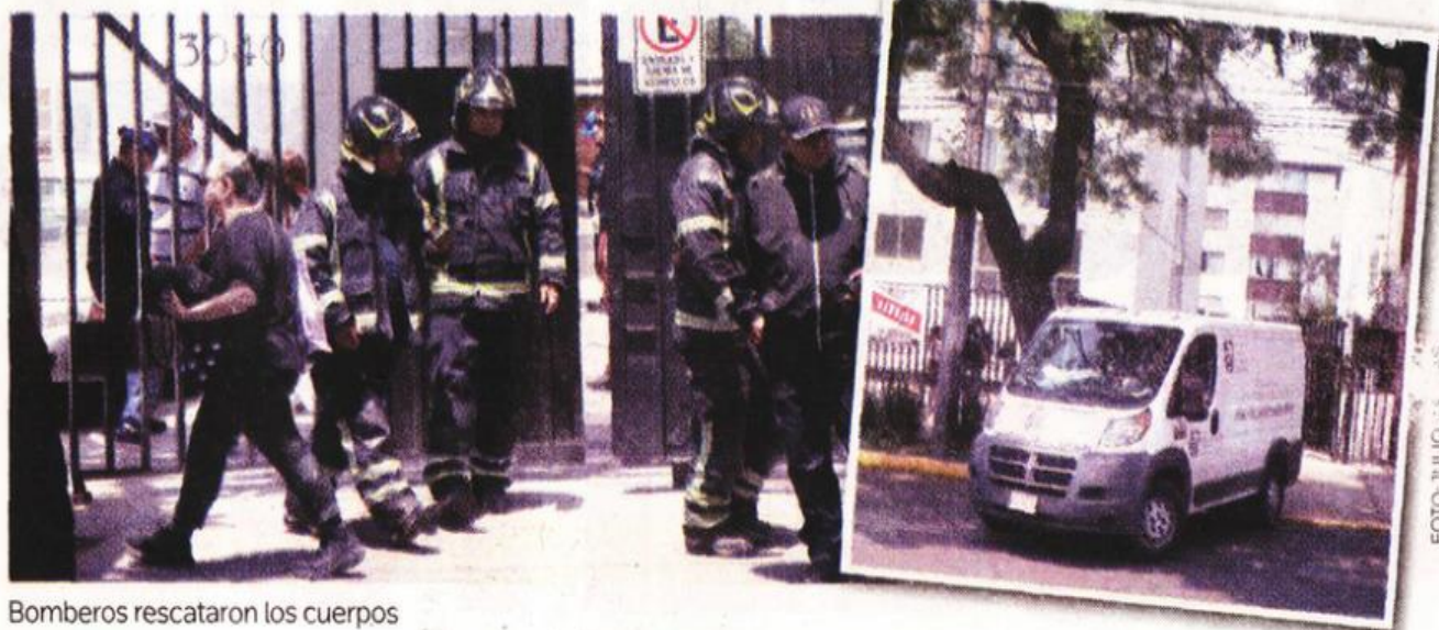
Bomberos rescataron los cuerpos