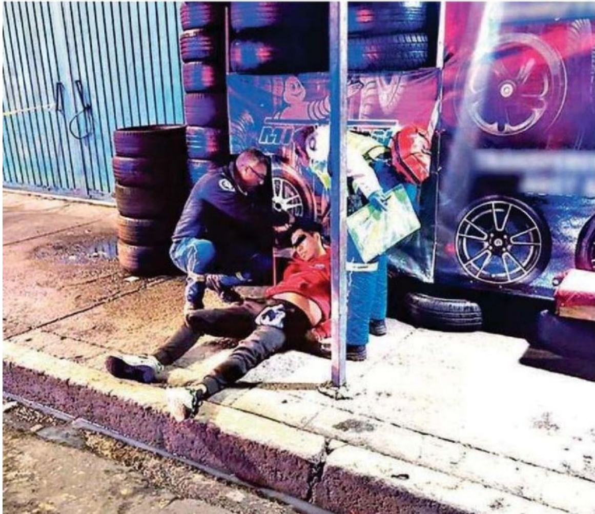
En medio de la trifulca, el agresor sacó un cuchillo de entre sus ropas y atacó a la víctima, provocándole una lesión fatal en el abdomen