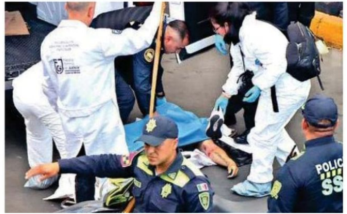
La fuerza del impacto fue tan violenta que el casco salió desprendido, mientras el luchador quedó tendido en el asfalto con lesiones mortales