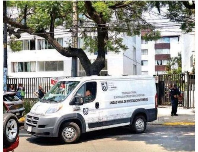
"No hay riesgo alguno para los demás moradores del edificio, pueden ingresar a sus departamentos sin problema" , señaló un bombero