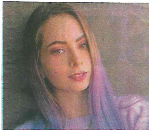
Está metida en graves problemas

La pornografía infantil está sumamente penada y si la youtuber es encontrada culpable podría alcanzar una pena muy severa