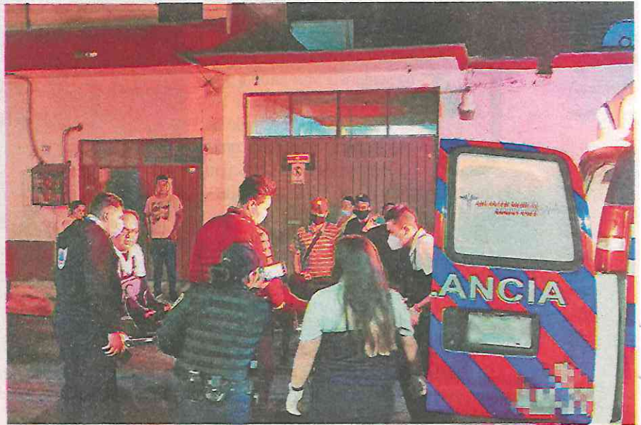
La víctima tenía varios ingresos a penales y murió en presunta venganza

En el lugar, uniformados se entrevistaron con Leslie Angélica "N" de 30 años de edad, esposa de la víctima, quien mencionó que mientras se encontraba realizando algunas actividades al interior de su vivienda, escuchó varios disparos venir