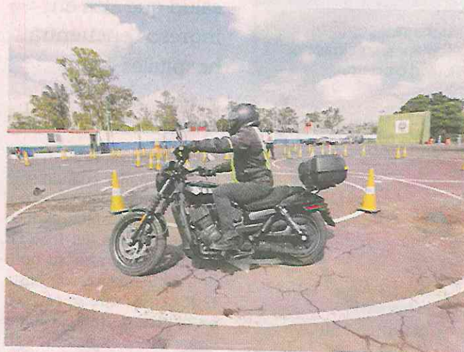
■ La muestra se llevó a cabo en un depósito vehicular de la SSC.

Enfatizó que la campaña integral que es realizada por la Semovi se enfoca desde la infraestructura, como el retiro de boyas y la reparación de alcantarillas en mal estado, hasta la concientización de conductores de automóviles o camiones.