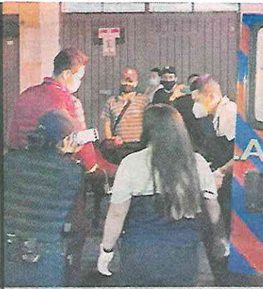
■ El ex convicto fue trasladado a un hospital, pero falleció.