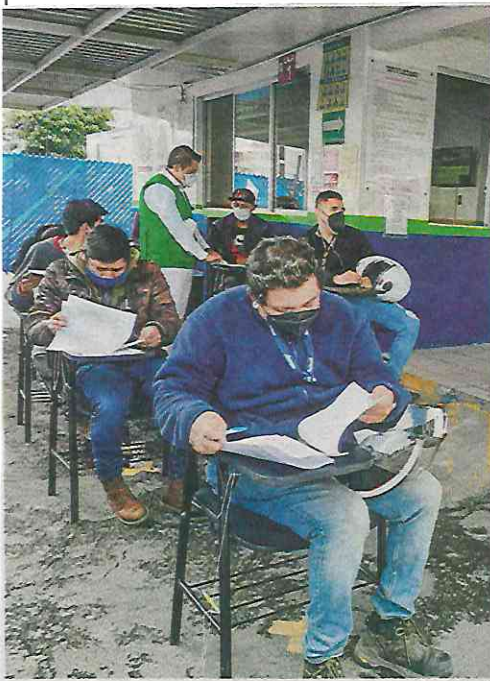
BIKERS A LA ESCUELA. Además de un examen teórico, los motociclistas deben pasar una prueba de circuito para obtener la licencia.