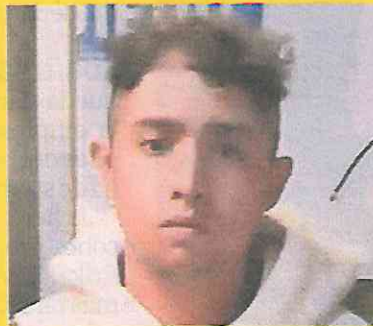
Policías agarraron al responsable.

El crimen ocurrió en las últimas horas de la noche del miércoles en un edificio ubicado sobre la calle Lago Ness y Lago Ginebra,