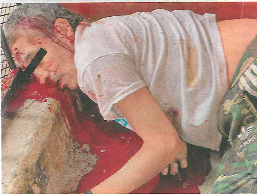
Los tiros le destrozaron la cara y su cuerpo quedó al ras de una escalera