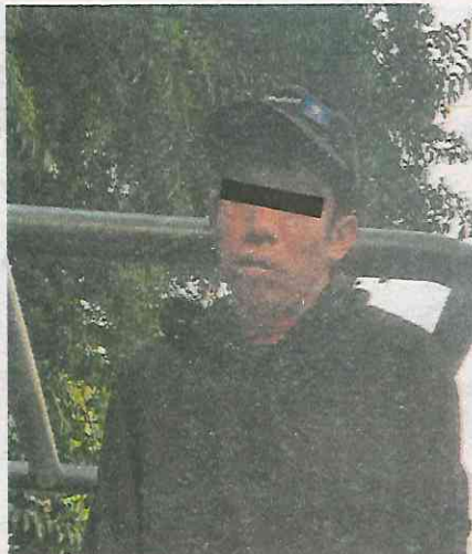
Huyó del lugar a toda prisa, pero le cayó la ley y será investigado

En esos momentos fue encontrado por un sujeto, quien al tenerlo de frente y a corta distancia, sacó un arma de fuego y le dispa-