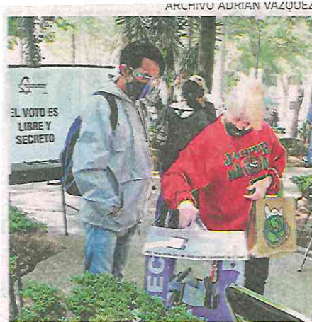
Esta es la segunda votación de 2021

Realización de Acciones a Implementarse con motivo de la Consulta Popular 2021, la Secretaría de Gobierno en colaboración con diversas instancias de la administración capitalina, coadyuvará con el Instituto Nacional Electoral (INE) en la vigilancia de casillas y traslado de paquetes durante