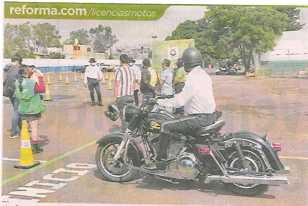
■ La Semovi realizó ayer la presentación de pruebas presenciales de conducción en motociclistas.