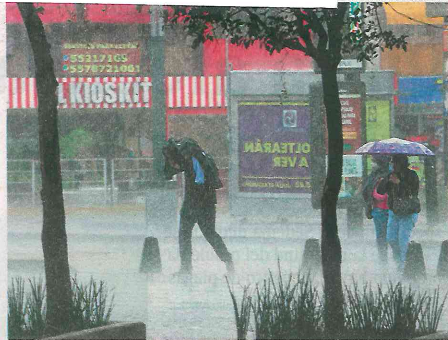
Chilangos tratan de llegar a su destino pese al aguacero

Las principales anegaciones se dieron en los bajo puentes de la alcaldía Gustavo A. Madero, así como en la Cuauhémoc