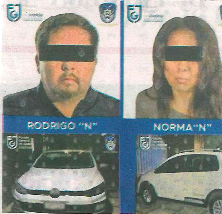
Se presumen que este hecho de violencia se debe a una venganza relacionada con gente ligada a la delincuencia organizada