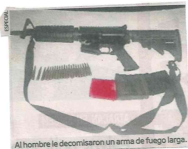
Al hombre le decomisaron un arma de fuego larga.