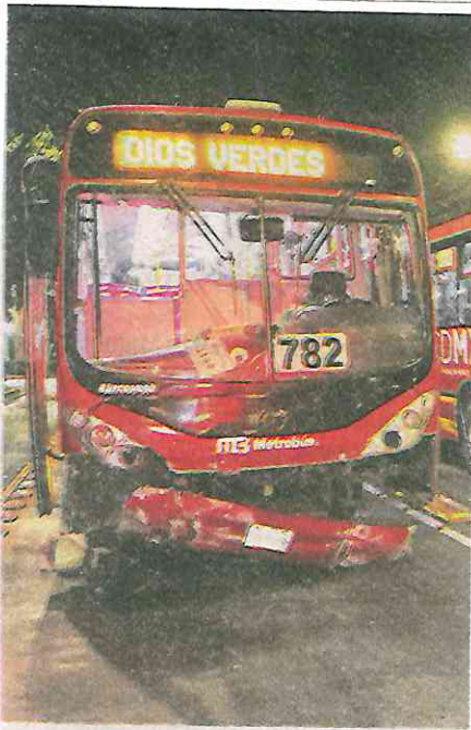
El autobús quedó destruido de la parte frontal

Mientras las dos femeninas que viajaban a bordo del Suzuki tipo Ignis, en color gris Oxford, eran valoradas en una unidad de atención prehospitalaria, se dio inicio a los trámites legales correspondientes.