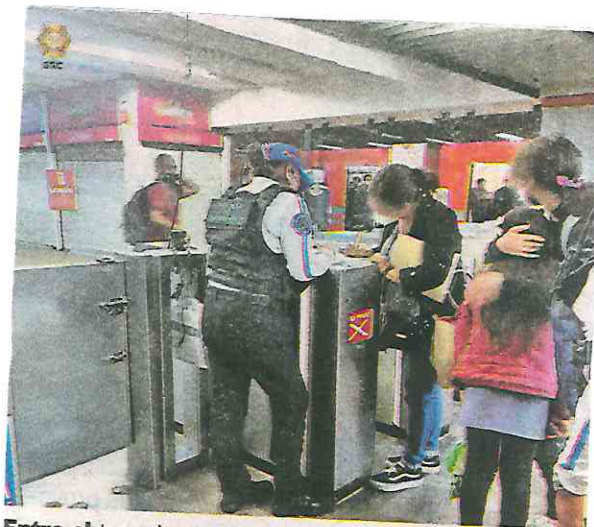
Entre el tumulto y empujones, la menor perdió de vista a su familiar

De esta manera reunieron a las dos mujeres, quienes se abrazaron efusivamente y tras identificarse plenamente y después de firmar la bitácora de hechos, la mamá agradeció el apoyo brindado por parte de los efectivos de la Policía Auxiliar y se retiraron del lugar.