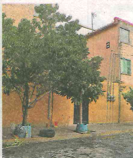
Anoche se registró en esta vecindad de la colonia Peralvillo una balacera, se presume tiene relación con La Ronda 88