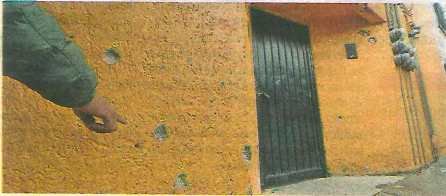
Fachada de la vecindad donde anoche se registró una balacera, resultando cuatro personas heridas /LUIS A BARRERA

En la escena de este hecho de violencia, los peritos y el Ministerio Público de la Fiscalía General de Justicia de la Ciudad de México encontraron más 30 casquillos percutidos de fusil de asalto, los cuales son analizados en los laboratorios de de la Coordinación General de Servicios Periciales de la FGJCDMX en busca de evidencias.