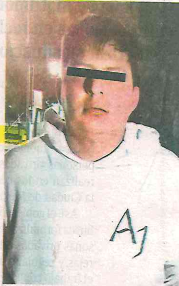
El Ale está relacionado con un robo a mano armada de una nómina

El imputado quedó a disposición del Ministerio Público de la