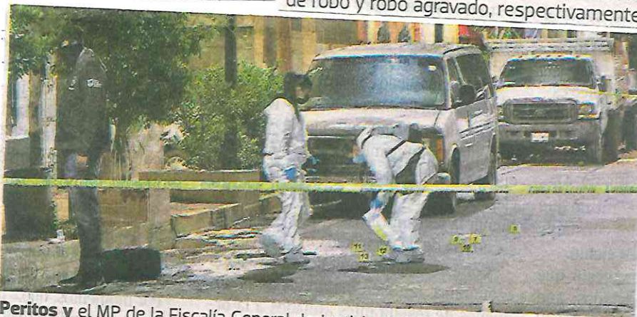
Peritos y el MP de la Fiscalía General de Justicia de la Ciudad de México encontraron más 30 casquillos percutidos de fusil de asalto

SE SUPO que el detenido cuenta con dos ingresos al Sistema Penitenciario de la Ciudad de México, en los años 1998 y 2005, por los delitos de robo y robo agravado, respectivamente