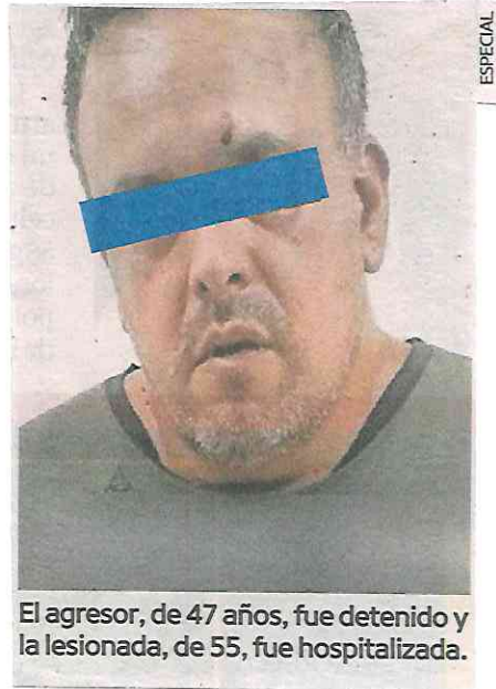
El agresor, de 47 años, fue detenido y la lesionada, de 55, fue hospitalizada.

Los agentes ubicaron al supuesto agresor, a quien le aseguraron un cartucho y lo presentaron ante el Agente del Ministerio Público, quien determinará su situación legal.