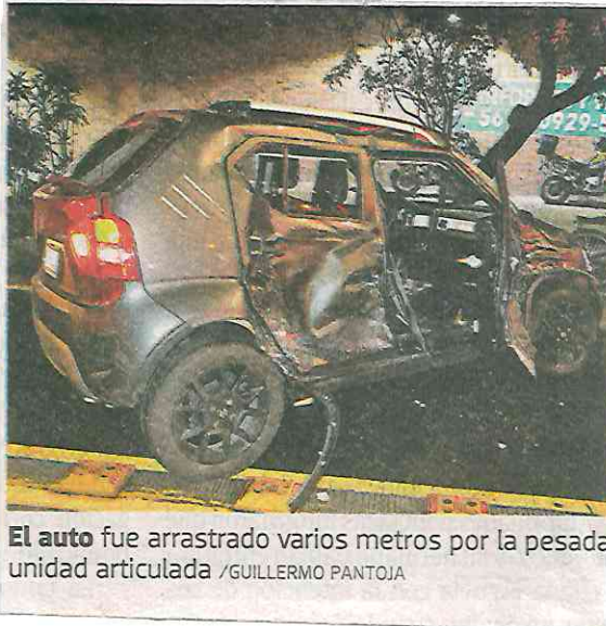
El auto fue arrastrado varios metros por la pesada unidad articulada / GUILLERMO PANTOJA