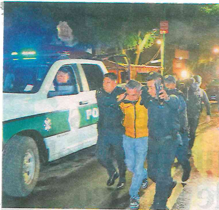
La SSC detuvo a un hombre en posesión de un arma de fuego, señalado como probable responsable de realizar disparos