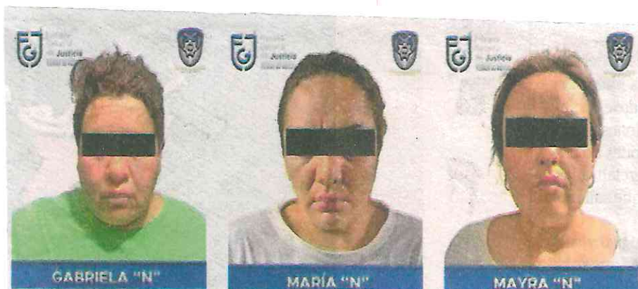
A estos integrantes de La Ronda 88 les han asegurado vehículos, armas cortas y largas, entre ellos fusiles de asalto AR15 y droga