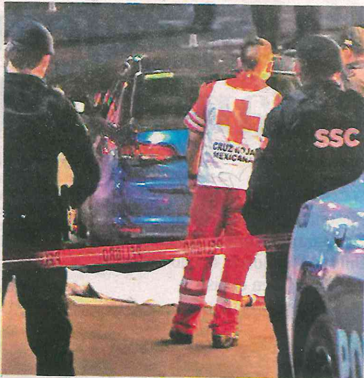
Arribaron dos sujetos en motocicleta y descargaron sus armas en contra de la pareja

Uniformados resguardaron el perímetro donde paramédicos de la Cruz Roja atendieron a el hombre de 30 años y a la