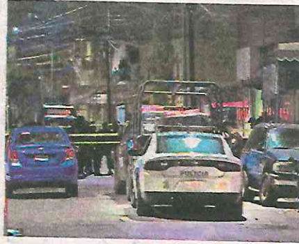
Elementos de la SSC acordonaron la escena del crimen