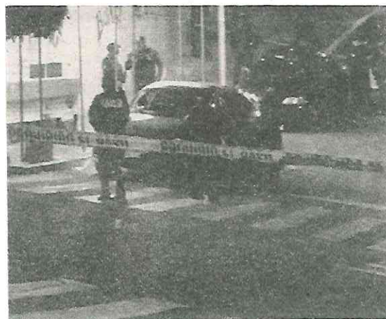
Ante los hechos la taquería tuvo que cerrar