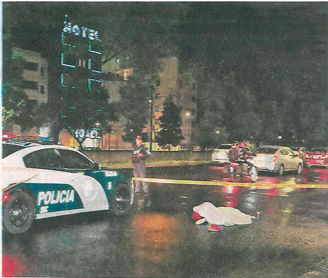
El accidente ocurrió en el cruce de la Calzada de Tlalpan y Avenida Xotepingo, alrededor de las 22:00 horas