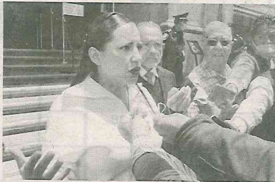
Administración repleta de enfrentamientos