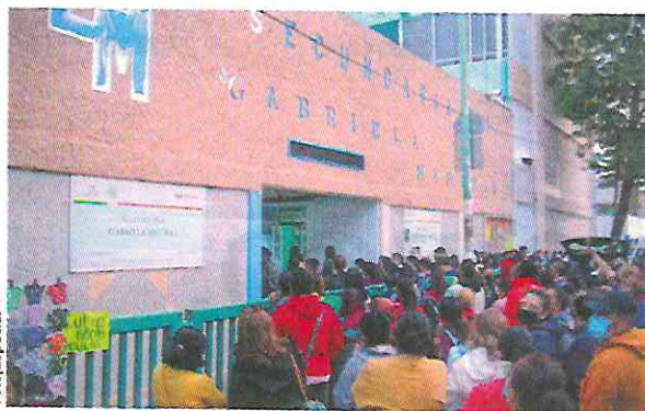
AFUERA de la secundaria Gabriela Mistral se registraron aglomeraciones, ayer.