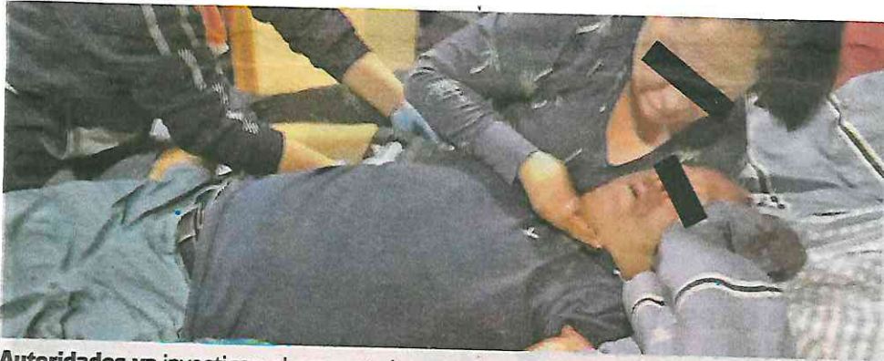
Autoridades ya investigan el presunto intento de suicidio

"N", de 28 años de edad, quien mencionó ser su hijo, quien aseguró que al interior de hogar su padre se había dado un tiro en la cabeza.