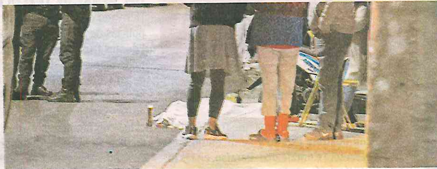
Ajuste de cuentas se maneja como posible motivo del homicidio

Sin embargo, serán los avances de las investigaciones que realicen los encargados del gabinete de seguridad del gobierno de la Ciudad de México, los que determinen. La noche del pasado lunes, un hombre apodado "El París" de aproxima-