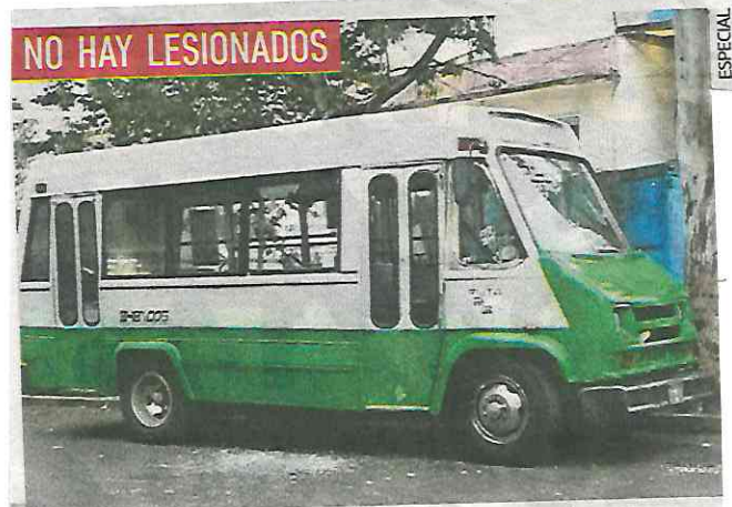
La unidad estaba estacionada en la colonia Tezozómoc.

Se presume que el ataque está relacionado con un intento de extorsión, pero la Fiscalía de la CDMX agotará otras líneas investigación.