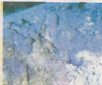
Los restos encontrados

Por la forma en que fueron sacrificados y enterrados, todo hace suponer que se trató de una venganza