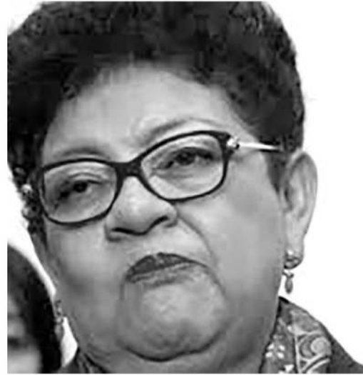
Que le hicieron ley a modo, dice el PAN