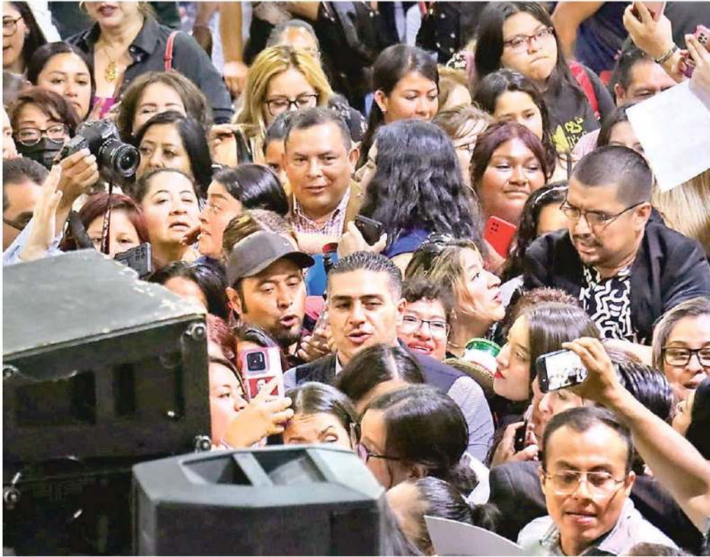
Omar García Harfuch, aspirante a coordinador de los comités de la defensa de la 4T de la CdMx