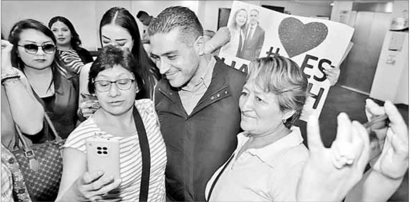
► El aspirante morenista se reunió con simpatizantes en un local del Paseo de la Reforma, donde le expresaron su apoyo.