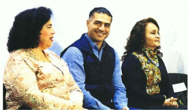
Omar García Harfuch ofreció un mensaje en Expo Reforma.