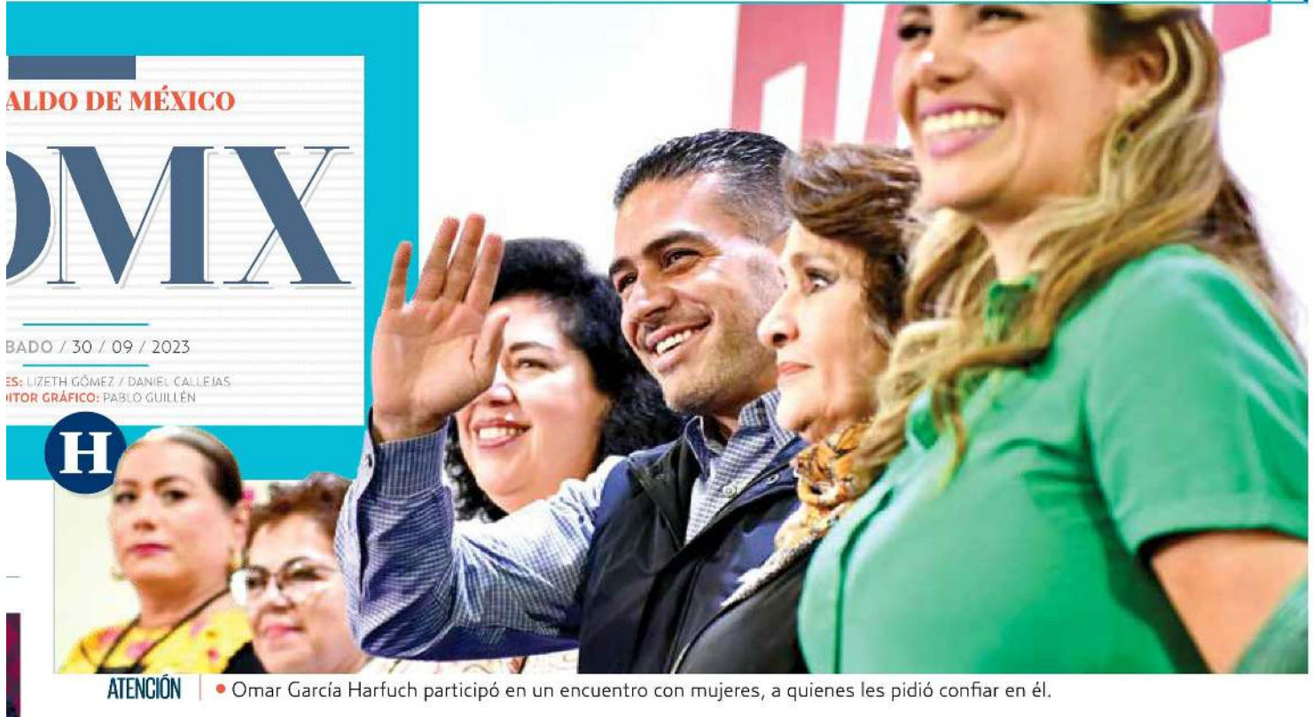
ATENCIÓN | • Omar García Harfuch participó en un encuentro con mujeres, a quienes les pidió confiar en él.