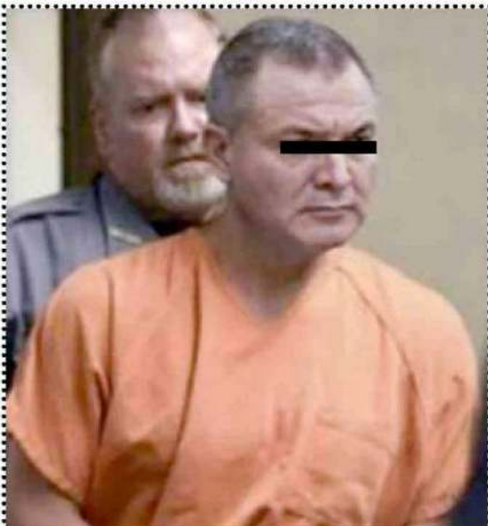
Genaro García Luna