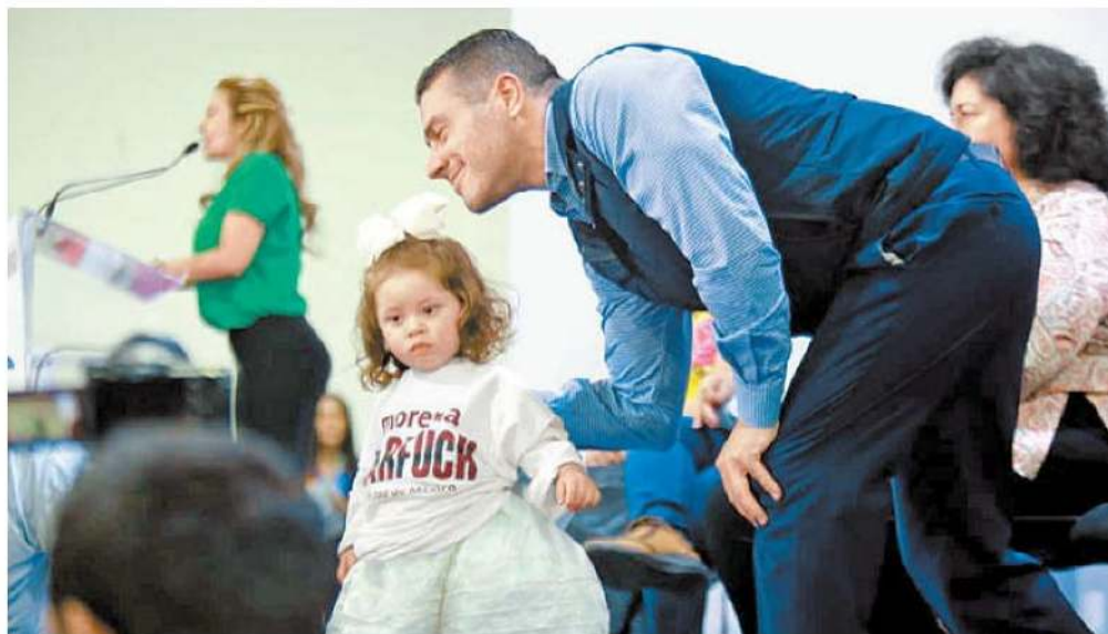
Omar García Harfuch busca gobernar CdMx. JUAN CARLOS BAUTISTA