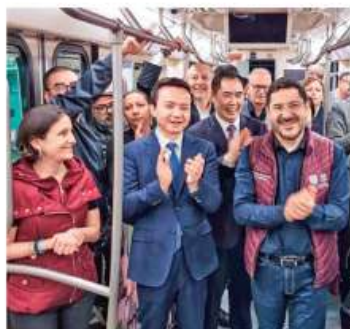
IGNORADOS. En la reapertura de 11 estaciones reparadas del Metro, ningún legislador fue invitado.