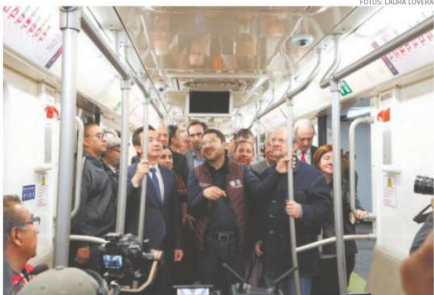
La Línea 1 del Metro cumplió su vida útil hace 13 años, por lo cual el gobierno la moderniza

De acuerdo con Batres Guadarrama, la segunda fase de la remodelación, que será de Balderas a Observatorio, comenzará en cerca de 10 días. Adicionalmente se llevarán las obras de nivelación en tres estaciones de la Línea 9.