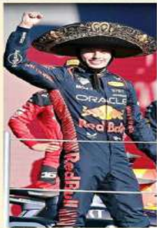
Max Verstappen en su quinto triunfo en México.

"No me salió, pero lo dimos todo por buscar esa victoria. Nos vemos el próximo año y lo volveremos a intentar", dijo Pérez tras quedar fuera de la carrera; ahora sólo tiene ventaja de 20 puntos