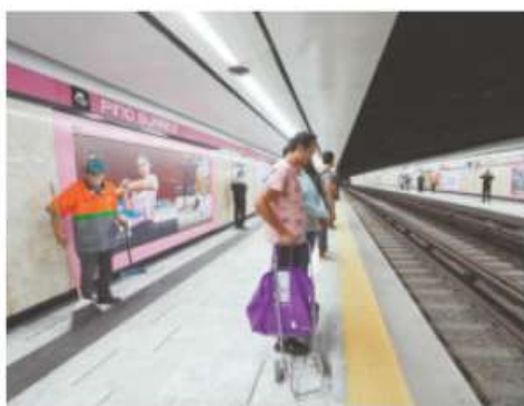
La empresa china CRRC se encarga de las obras