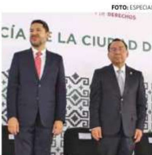
• ACTIVOS. Resaltan cooperación.