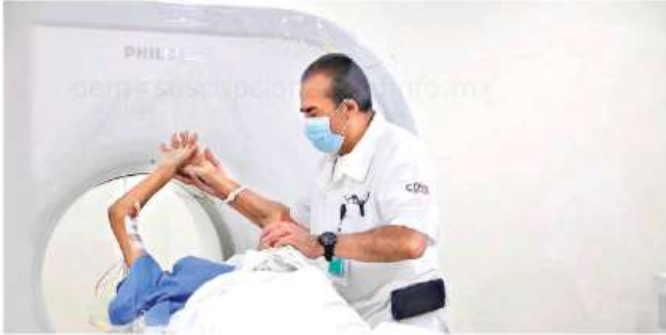
Serán siete los tomógrafos que se sumaran a la red del IMSS_Bienestar