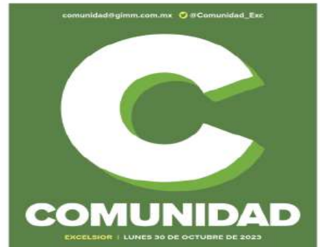
Ilustración: Erick Retana

Quijano también dijo que han reforzado la economía local: "Hemos hecho muchas ferias de trabajo con las empresas que tenemos en la alcaldía y hemos dado apoyo económico directo a pequeños comerciantes, así como las ferias del pulque, la barbacoa, del taco, y los negocios que participan han vendido sus productos y se han podido recapitalizar".