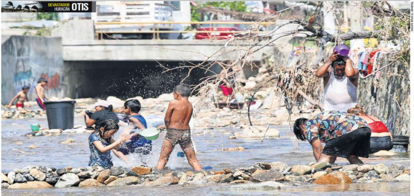
Ante la escasez de agua en el puerto de Acapulco, decenas de personas llegan al río que atraviesa la colonia Caravana —por el que normalmente corren aguas negras— para bañarse y lavar su ropa.