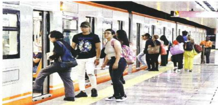
El tramo restaurado abarca 11 estaciones de la también llamada Línea Rosa del Metro.

En un recorrido entre Pantitlán y Balderas se consi-