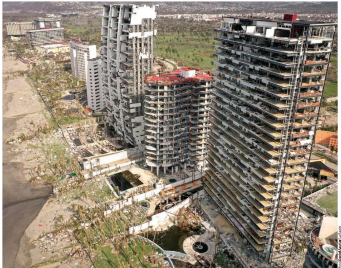
CONDOMINIOS ubicados en la Costera las Palmas en Acapulco Diamante, en imagen del sábado.

Cifra de muertos por Otis aumenta a 48, la de desaparecidos a 36; AMLO afirma que se logrará la hazaña de levantar la ciudad; acude hoy gabinete económico