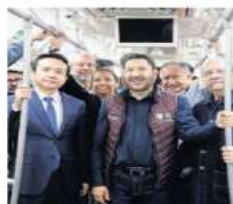
El jefe de Gobierno, Martí Batres, recorrió algunas estaciones de la Línea 1 del Metro.

De acuerdo con las autoridades del Sistema de Transporte Colectivo (STC) Metro serán 250 mil las personas que regresen al servicio que se presta desde