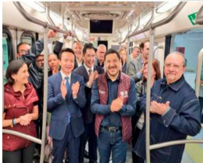
Se tomó la decisión de que se renovaría por completo la Subestación Eléctrica de Buen Tono, hoy Metro-Energía, proyecto que alimenta de electricidad a las Líneas 1, 2 y 3.

daciones de las que históricamente sufre la Ciudad de México, se sustituyeron tuberías y registros a lo largo de 11 kilómetros; de igual manera, 69 cárcamos fueron rehabilitados y equipados con equipo automático; asimismo, se construyeron y reestructuraron tres nuevos cárcamos de gran capacidad en zonas que presentaban problemas por ingreso de agua a las vías.