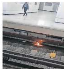
El STC informó que encontró un objeto metálico en las vías.

El director del Metro aseguró que las 11 estaciones recién remodeladas serán 100% accesibles para personas con discapacidad, con la instalación de 10 nuevos elevadores. ●