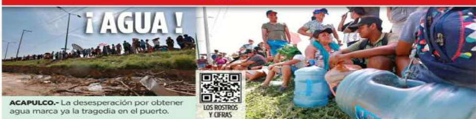
ACAPULCO.- La desesperación por obtener agua marca ya la tragedia en el puerto.