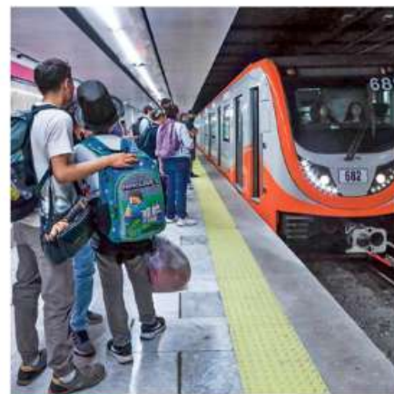
CONTRATIEMPOS. Usuarios reportaron retrasos en las nuevas estaciones y largas filas para el RTP en Balderas.