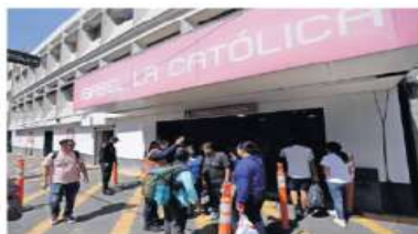
Los usuarios tuvieron que bajar en Isabel La Católica y tomar un RTP hacia Balderas.

Durante un recorrido que realizó este diario se observó que en Balderas personal de RTP aseguró que en Isabel La Católica sal-