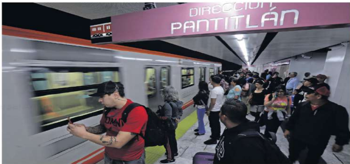
Los primeros pasajeros entraron a las instalaciones del Metro para abordar los trenes; muchos usuarios dieron a entender que la reapertura sería este domingo.