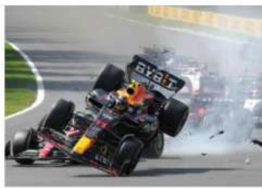
EL ACCIDENTE de Checo Pérez, ayer.