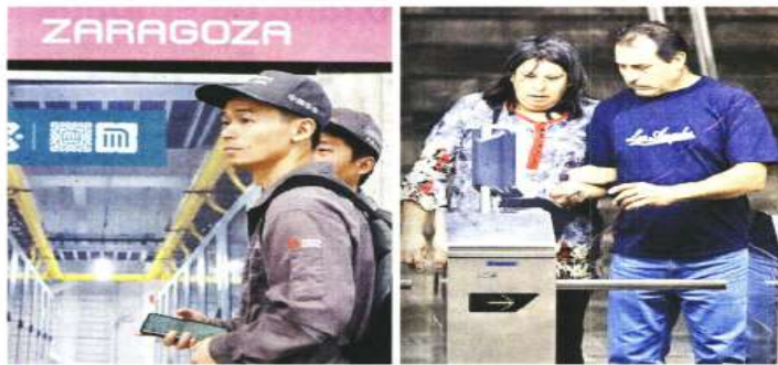
Los usuarios esperan que los traslados disminuyan en tiempo y forma.

atató que el tiempo fue de una hora y 15 minutos.