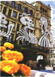
17 metros alcanzará una de las figuras.