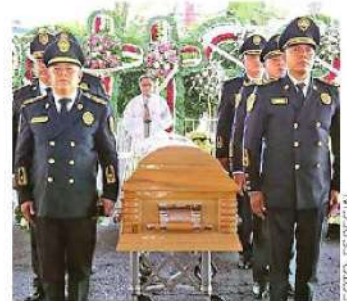
Custodiaron el féretro

La SSC reconoció el trabajo de Cuitlahuac Delta y los despidió con honores