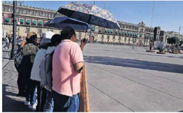
A lo lejos y con sombrillas para aguantar el calor, capitalinos y turistas observaban la instalación de la megaofrenda.