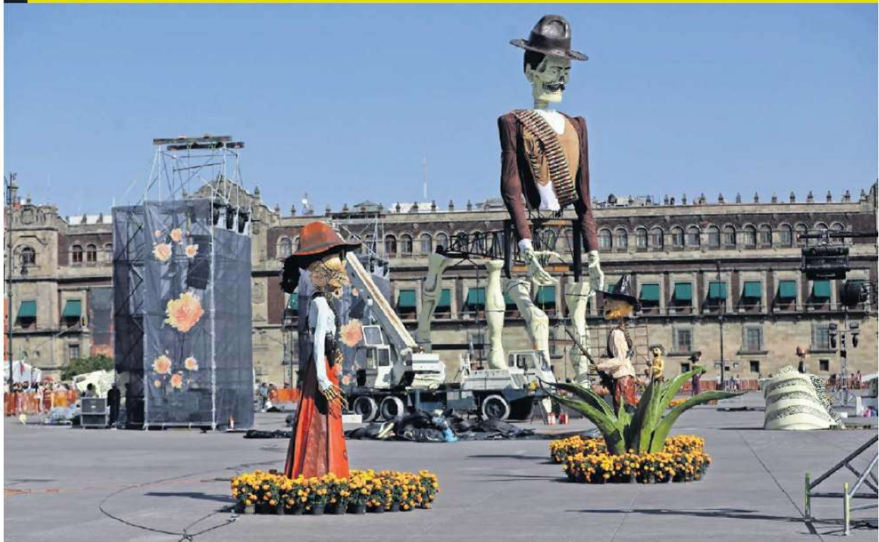
Desde temprano, trabajadores maniobraban para montar grandes calaveras de la megaofrenda, en la plancha del Zócalo.