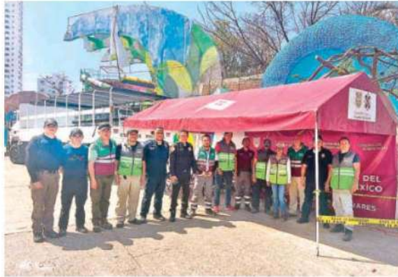
Es parte del auxilio que brinda el Gobierno de la Ciudad de México