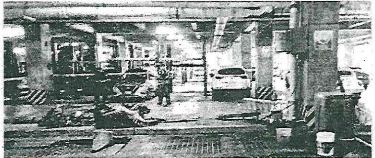
Los hechos ocurrieron en la colonia del Gas

Un guardia de seguridad también resultó intoxicado cuando acudió al auxilio de la víctima