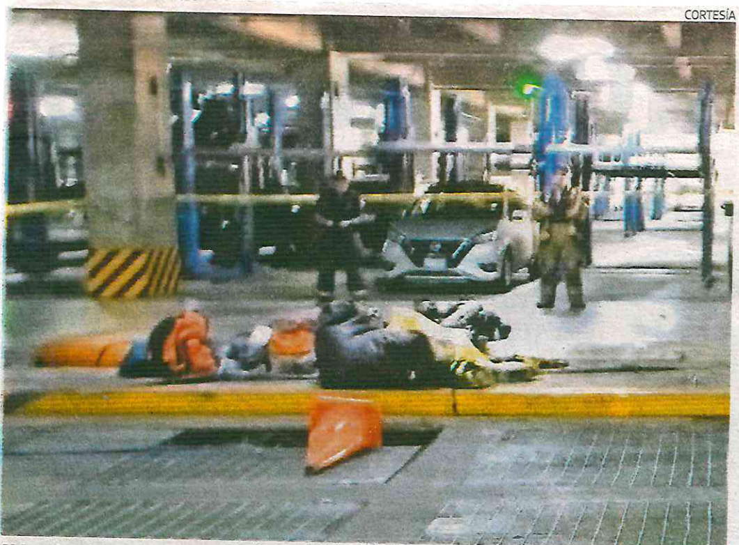
Al interior del estacionamiento de un centro comercial que comparte con un edificio condominal

Uno de ellos fue rescatado y tras estabilizado fue llevado en una ambulancia de la Cruz Roja al Hospital Ángeles Lindavista para su pronta atención médica