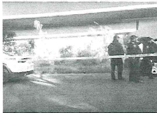
⊕ Los cadáveres tenían el tiro de gracia, aseguran.

Elementos de la Secretaría de Seguridad Ciudadana (SSC) acordonaron la zona y señalaron que las víctimas tienen aproximadamente entre 25 y 30 años. Mientras que peritos de la Fiscalía General de Justicia de la Ciudad de México (FGJCDMX) realizan el levantamiento de los muertos.