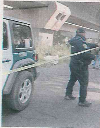
FRANCISCO RODRIGUEZ, EL UNIVERSAL

Las primeras versiones indican que los cadáveres fueron depositados en ese lugar por un vehículo compacto durante la madrugada del martes, así lo refieren testigos, quienes ya dialogaron con los agentes de investigación. Presuntamente pertenecen al sector de Cuatepec, zona en disputa por grupos ligados a La Unión Tepito y a un remanente del Cártel Jalisco Nueva Generación que opera en ese sitio y en la zona limítrofe con el Estado de México. ●