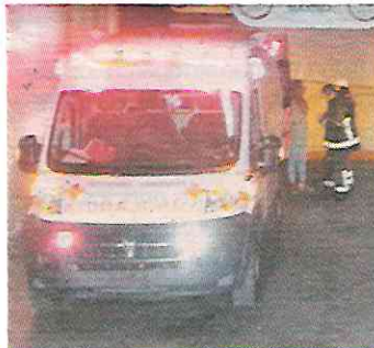
Personal de la Fiscalía capitalina realizó los peritajes.

Minutos después se presentaron bomberos, elementos de Protección Civil y paramédicos de Cruz Roja, pero sólo hallaron con vida al guardia y lo trasladaron de urgencia a un hospital privado.