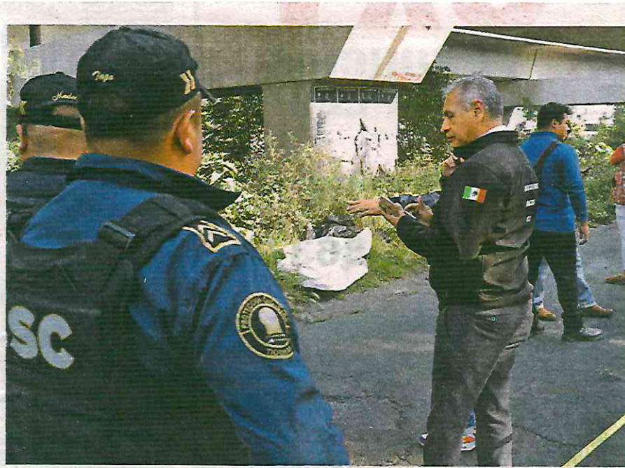
Elementos de la Secretaría de Seguridad Ciudadana SSC sector Ticomán resguardaron la zona

Como parte de las investigaciones, agentes de la Policía de Investigación y personal ministerial y peritos analizan imágenes de las cámaras de videovigilancia de la zona a fin de obtener pistas que los lleve al esclarecimiento de este doble asesinato.