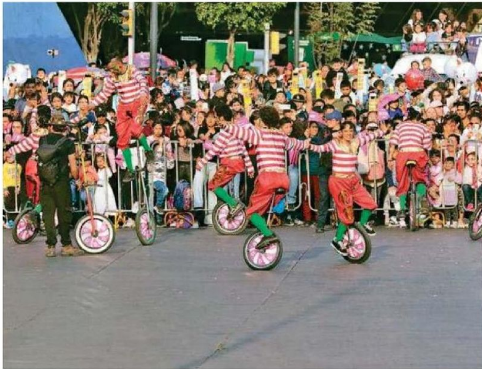
Durante el Bolo Fest 2025 , los asistentes pudieron disfrutar el desfile de carros alegóricos, globos gigantes y espectáculos alusivos a la temporada navideña