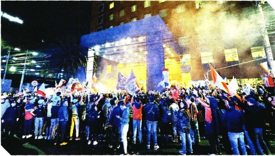
Como siempre que llega el Guadalajara a la capital se arma la fiesta al Sur de la CDMX.