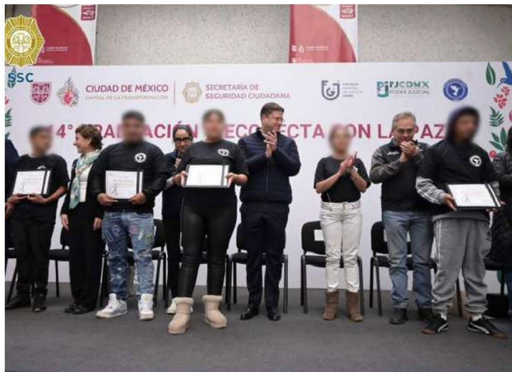
Más de mil 777 jóvenes que han sido asistidos por el Programa Reconecta con la Paz han tenido diez veces menos probabilidades de reincidir.