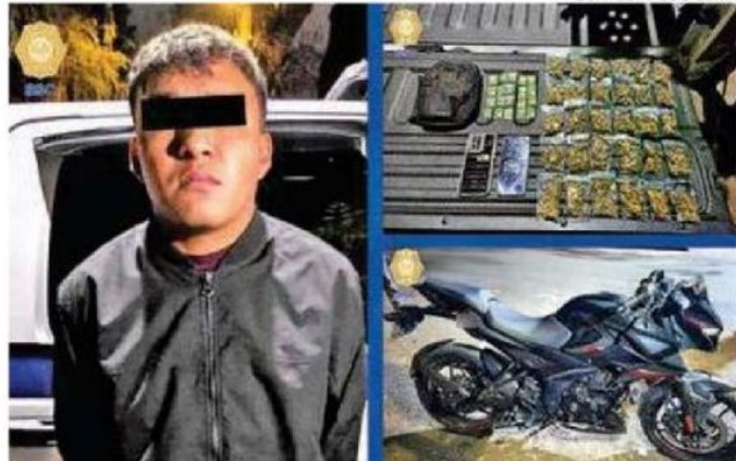
Es señalado como posible responsable del asesinato de un hombre

El detenido fue informado de sus derechos y, junto con la moto y la droga asegurada, quedó a disposición del MP