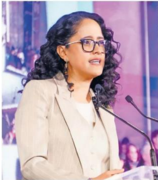
En su primer Informe, la alcaldesa de Tlalpan mencionó el reforzamiento de la seguridad en los pueblos de la montaña y la realización de más de 30 búsquedas en el Ajusco y Topilejo.

Alcaldesa de Tlalpan destaca reducción de 24% en delitos; señala trabajo conjunto con la presidenta Sheinbaum