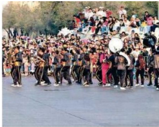
Orquestas ambientaron con música el desfile