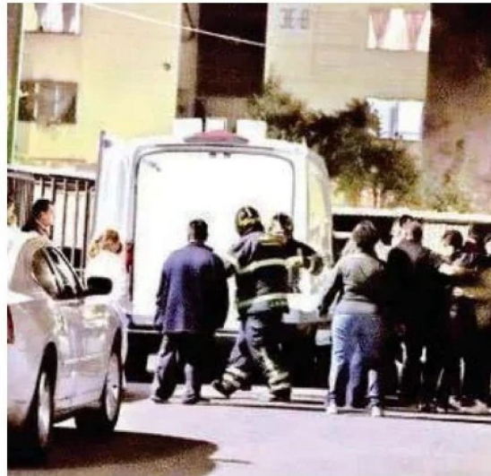
Dentro del departamento no había señales de forcejeo

El departamento quedó vacío, pero el eco de la tragedia sigue, donde tres vidas se apagaron sin ruido, sin advertencia, dejando una herida profunda entre quienes los conocían.