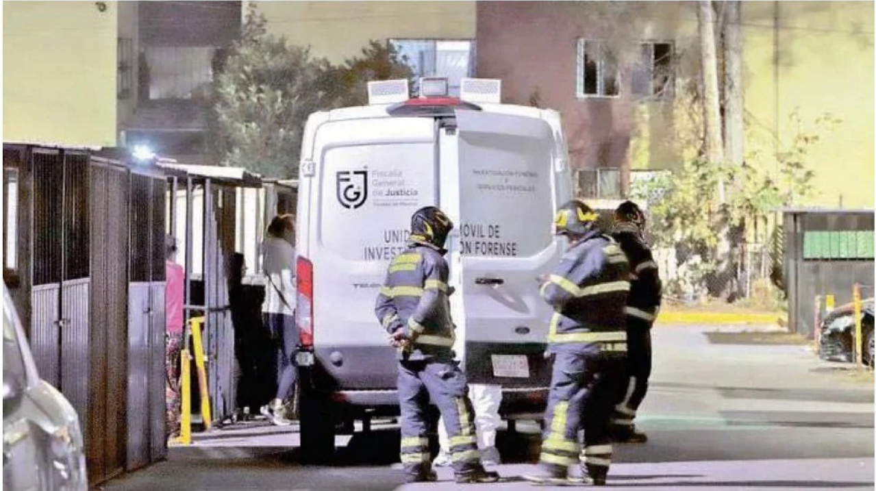
Los cuerpos fueron trasladados al anfiteatro correspondiente, mientras el MP inició una carpeta de investigación para determinar el punto exacto de la presunta fuga