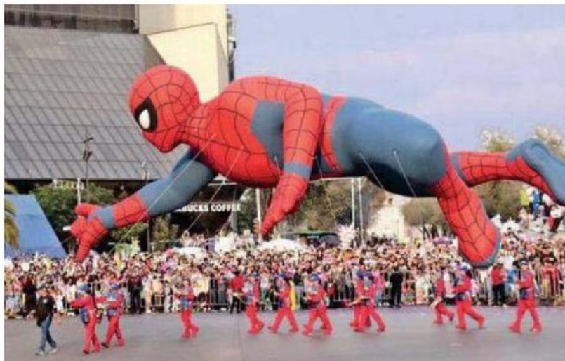
Los globos gigantes fueron de los favoritos de los miles de asistentes