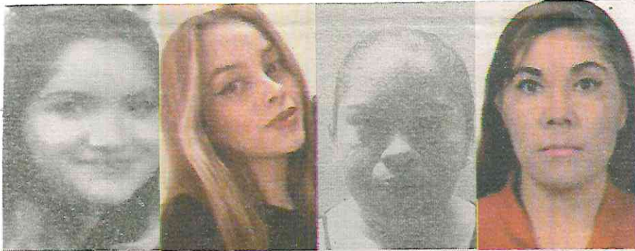
· Víctimas de la incapacidad de la administración de Francisco Chiguil