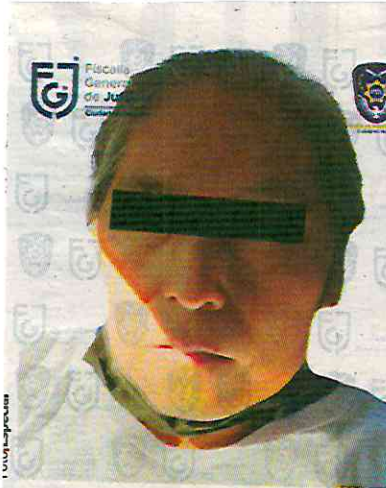
LA PRESUNTA responsable, en imagen difundida por la Fiscalía de Justicia capitalina, ayer.