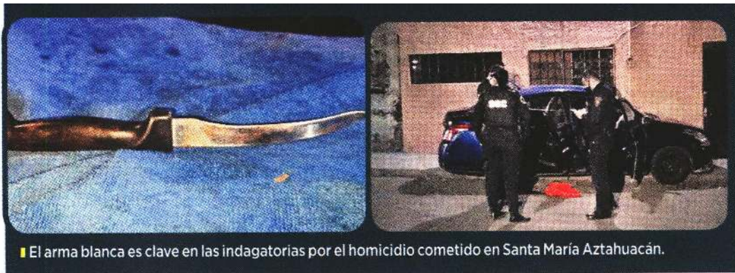
El arma blanca es clave en las indagatorias por el homicidio cometido en Santa María Aztahuacán.