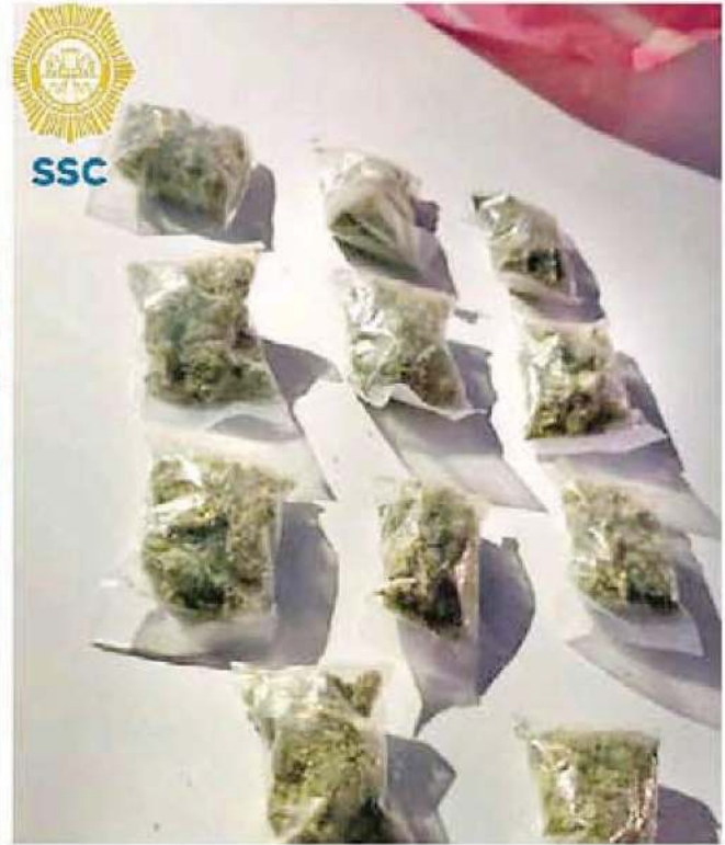
El hombre en actitud sospechosa fue monitoreado y aprehendido en el área de pescados de la Central de Abasto