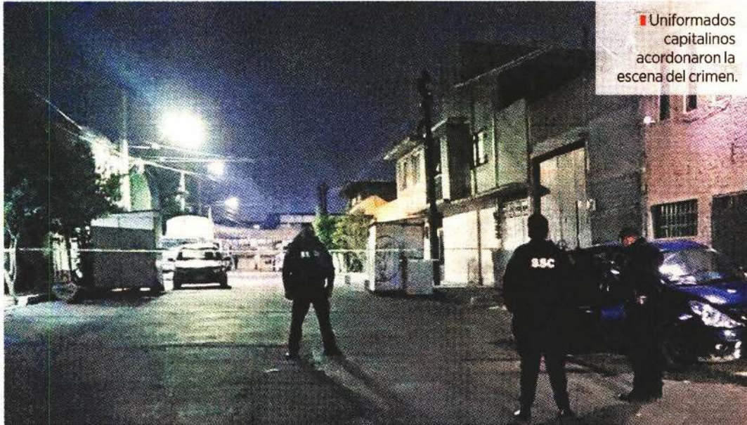
Uniformados capitalinos acordonaron la escena del crimen.