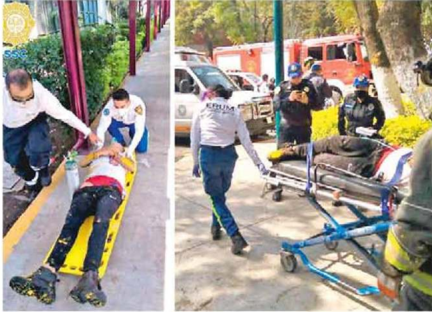
Las personas desmayadas dentro de la cisterna por inhalar solventes fueron trasladadas para recibir atención médica