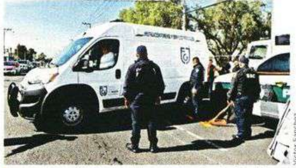
Los presuntos implicados fueron entregados a la Fiscalía capitalina.