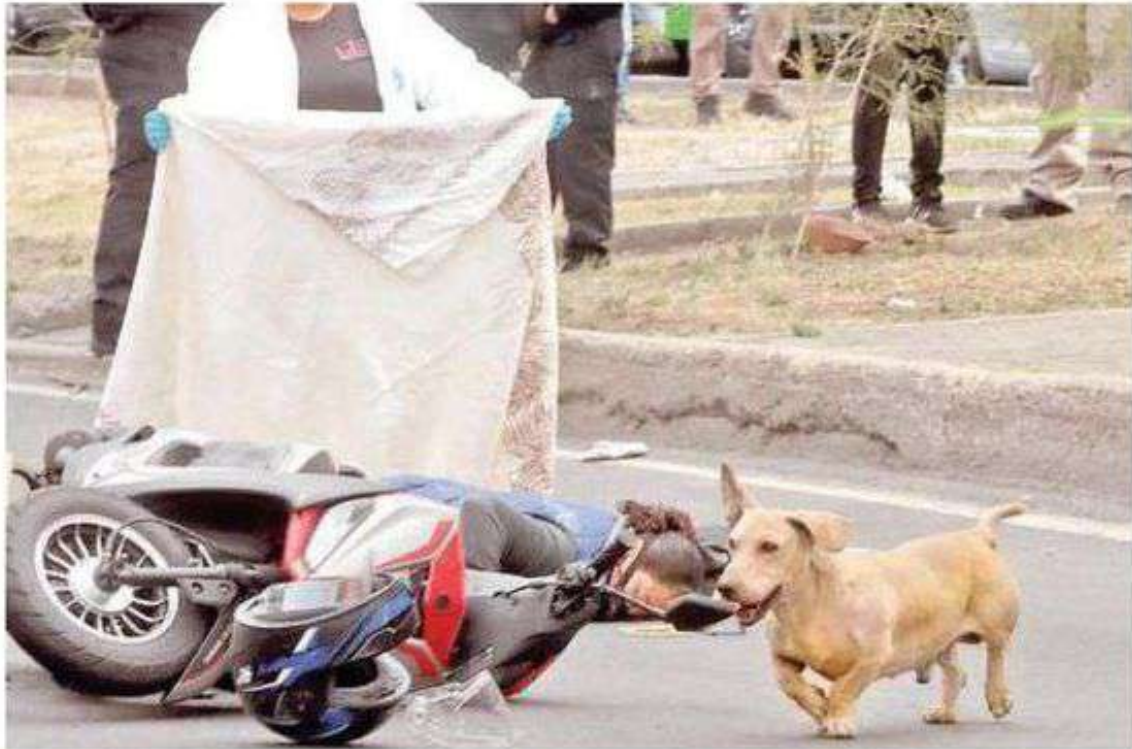
Una ambulancia de Protección Civil acudió al sitio, pero debido a las lesiones que sufrió al momento de ser atropellada, nada pudieron hacer por salvar su vida