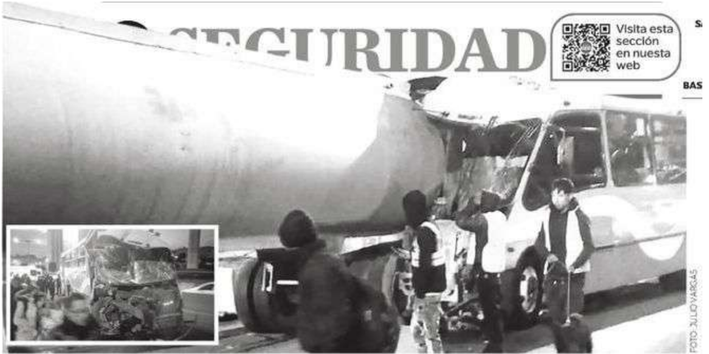
Iba tan patón que no alcanzó ni a frenar