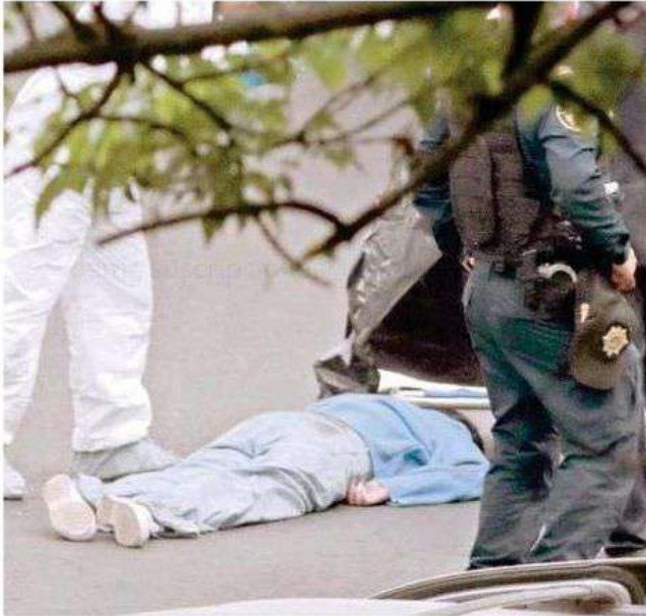
La mujer permaneció inmóvil sobre la vía vehicular, mientras testigos trataban de auxiliarla y de solicitar ayuda del 911