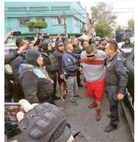
A través de diversas labores operativas de Inteligencia y seguimiento, llevadas a cabo de forma simultánea por policías, se logró ubicar y detener a los involucrados