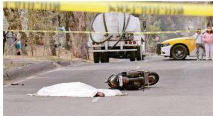
La biker circulaba sobre la lateral del Eje 6 Sur, Ermita Iztapalapa, entre Calle 45 y Calle 47, cuando ocurrió el accidente