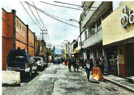
En el centro de Xochimilco, un operativo fue desplegado para retirar el comercio ambulante.

Resaltó que en este año se continuarán implementando acciones para liberar la vialidad del comercio informal en la Alcaldía.