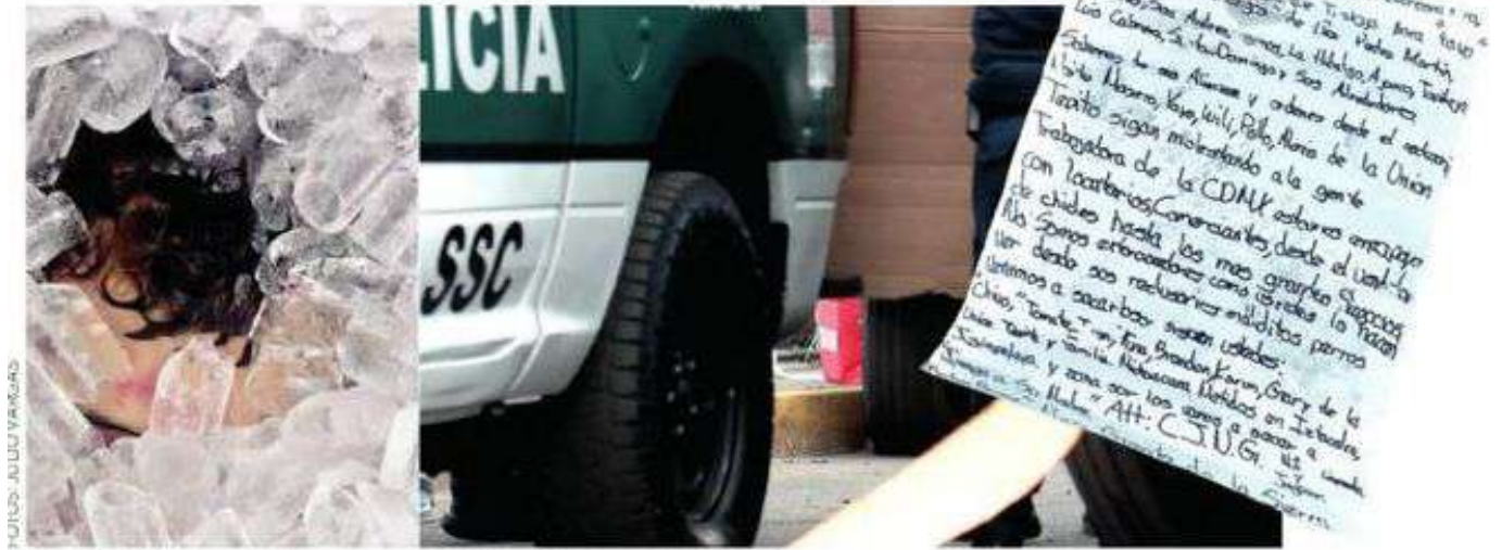
Se trató de una vendetta entre miembros del crimen organizado