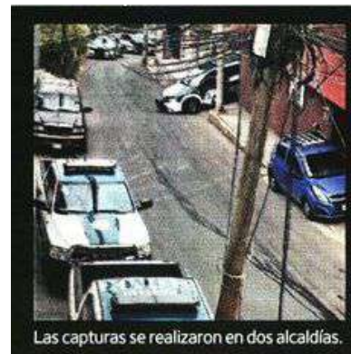
Las capturas se realizaron en dos alcaldías.

Los detenidos fueron trasladados a las instalaciones de la Fiscalía General de Justicia, en la colonia Jardín, en la alcaldía Azcapotzalco.