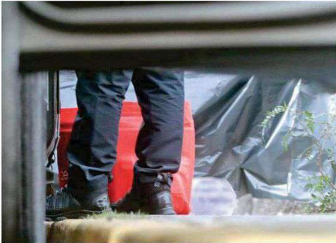
Habitantes se llevaron horrible susto al descubrir que entre hielos se encontraba la cabeza de una persona