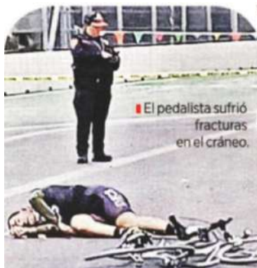
El pedalista sufrió fracturas en el cráneo.