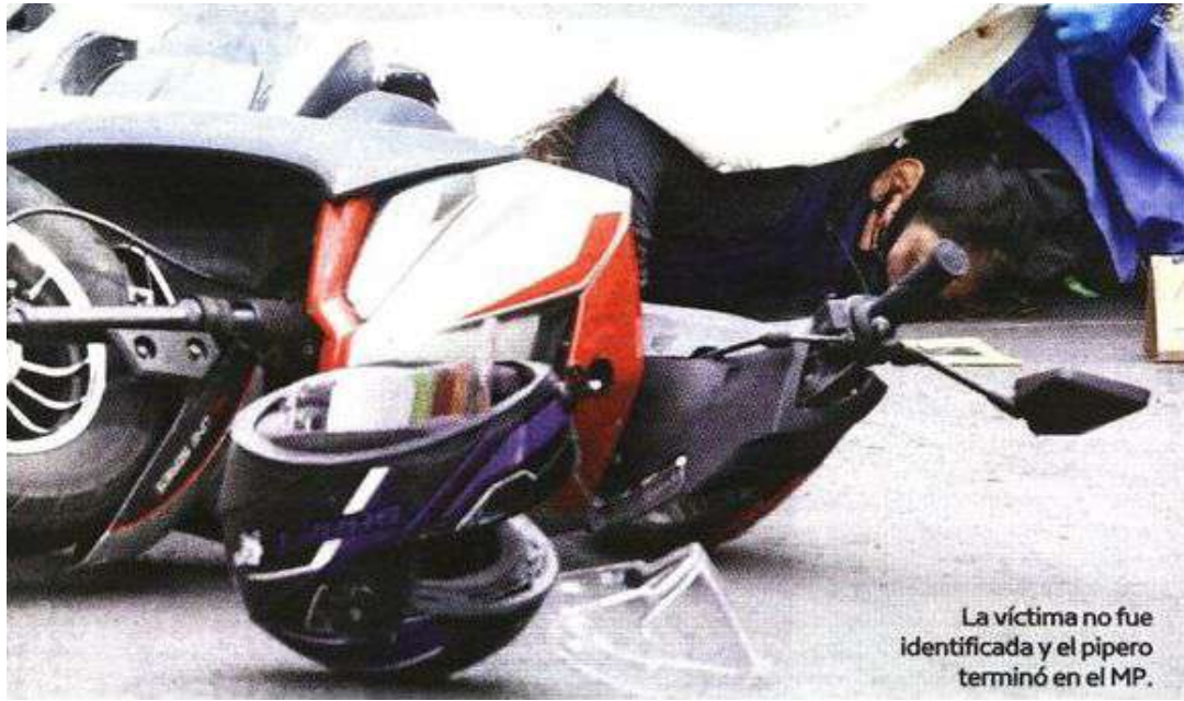
La víctima no fue identificada y el pipero terminó en el MP.