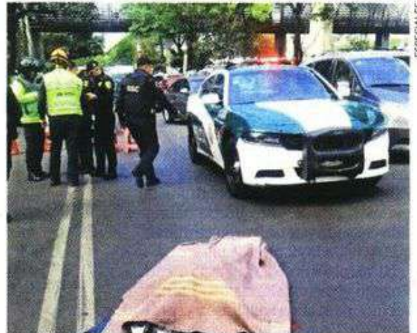
Las autoridades indagan las circunstancias en las que la joven perdió la vida en pleno Periférico.