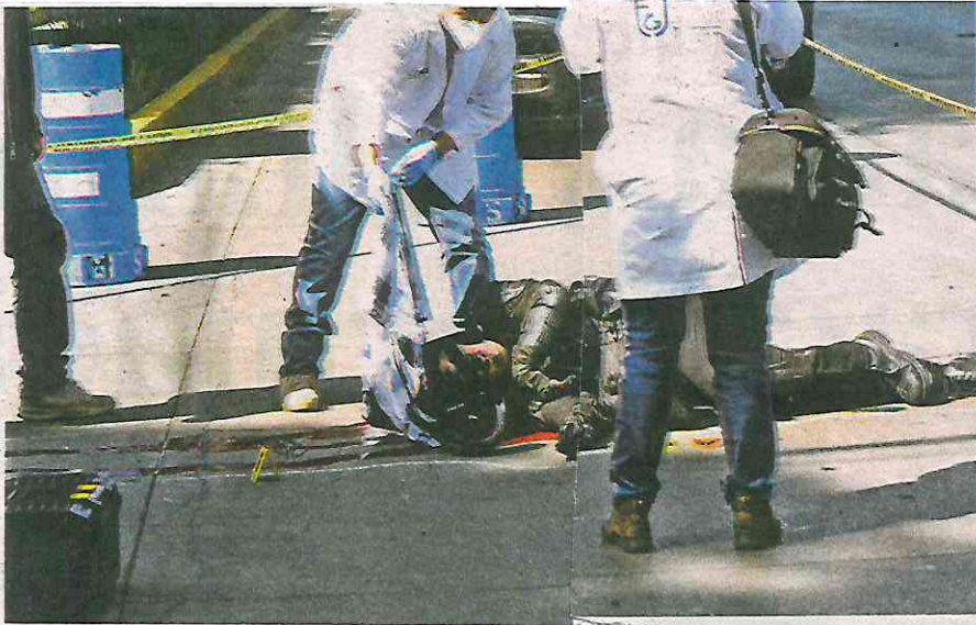
Peritos de la FGJCDMX realizan la inspección ocular en la escena donde quedó el cuerpo del conductor de una motocicleta que fue arrollado y muerto