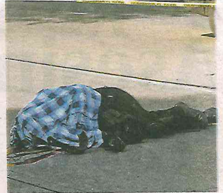
Investigadores de la fiscalía capitalina recogen evidencias de la muerte del motociclista

ción, no sobrevivió a los fuertes impactos recibidos tras ser arrollado, por lo que nada pudieron hacer por él.