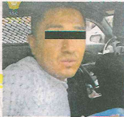
En la revisión precautoria, hallaron las pertenencias de las víctimas

En consecuencia, el detenido previa lectura de sus derechos de ley, fue trasla-