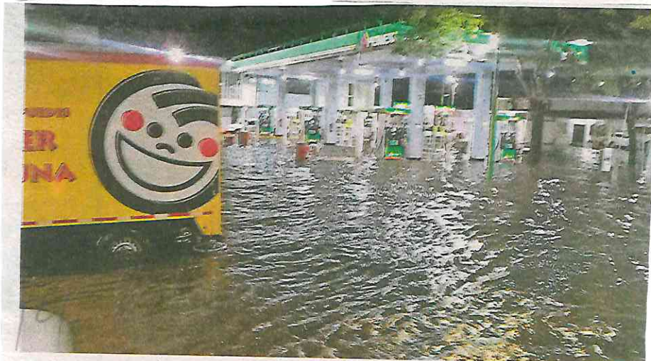
Llovió sobre mojado la tarde-noche de ayer en la capital mexicana

A su vez, en la Alcaldía Cuauhtémoc se registró la caída de al menos dos árboles, por lo que el tránsito local se vio afectado durante una hora, debido a las labores del