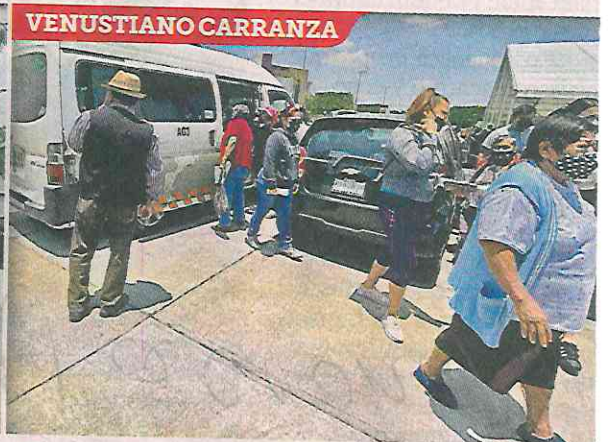
■ Los acarreados fueron llevados al centro de votación en la explanada de la Alcaldía.