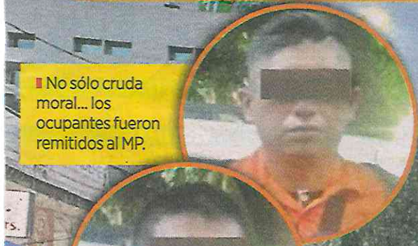
■ No sólo cruda moral... los ocupantes fueron remitidos al MP.