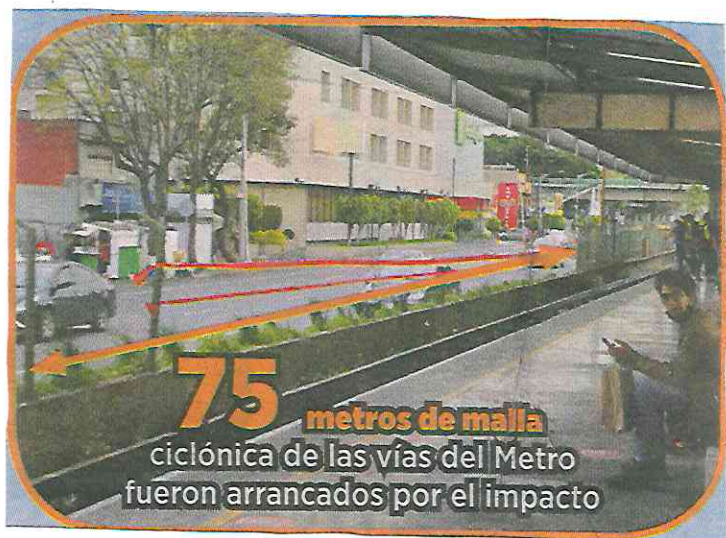
75 metros de malla ciclónica de las vías del Metro fueron arrancados por el impacto

Unos mil 300 usuarios tuvieron que desalojar las instalaciones y abordar las unidades de la Policía para dirigirse a sus destinos.