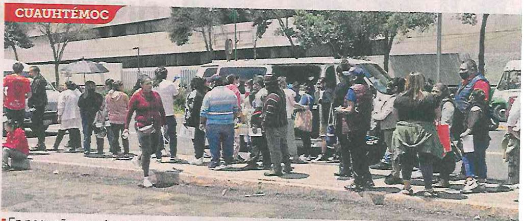
■ En pequeñas camionetas trasladaron a morenistas a votar en Tlatelolco.

Pocos se acercan a la mampara donde están los nombres de quienes compiten por una de las 10 plazas de congresistas nacionales del distrito 13, pues la mayoría ya sabe o lleva su papeliito en el que se le señala por quién votar.