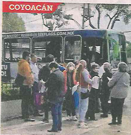
■ Un autobús acarrió a los votantes hasta la calle de Mayorazgo.