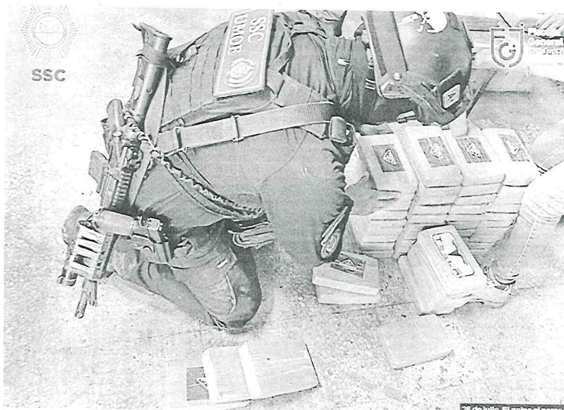
26 de julio. El golpe al narco

de Sinaloa y Jalisco Nueva Generación, así como líderes delincuenciales locales vinculados con ellos, la morenista sigue con sus guas en la capital y en las entidades donde, además de la autoproletariado y promoción personal, destaca la estrategia de seguridad de su gobierno y la coordinación con el del presidente Andrés Manuel López Obrador.