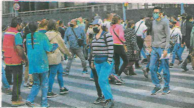
La población tiene contacto con el tránsito vehicular como peatones, pasajeros o ciclistas

Sin embargo, la Ley de Educación capitalina refiere el tema de manera general y no como un derecho de niñas, niños y adolescentes. Sólo en la fracción XXIV del artículo 7 establece la necesidad de promover la educación vial a través de actividades extracurriculares.