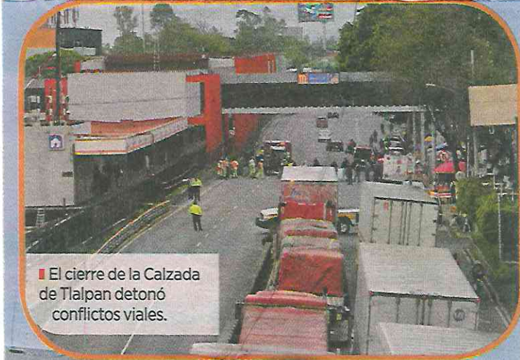
■ El cierre de la Calzada de Tlalpan detonó conflictos viales.