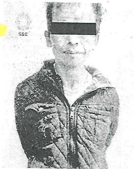
Al parecer sustrajo herramientas de un vehículo en Ampliación San Marcos Norte

Al arribar al sitio, los oficiales se entrevistaron con un ciudadano quien refirió que, momentos antes, el hombre al que agredían físicamente, sustrajo herramientas de su vehículo color gris con verde; y ante este hecho, al hombre de 42 años de edad se le realizó una revisión preventiva, de acuerdo con el protocolo de actuación policial, tras la cual se le aseguró un gato hidráulico y un autoestéreo.