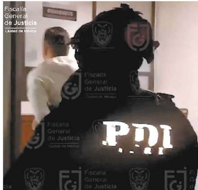
⊕ Este individuo fue detenido en un domicilio de la colonia Peralvillo.