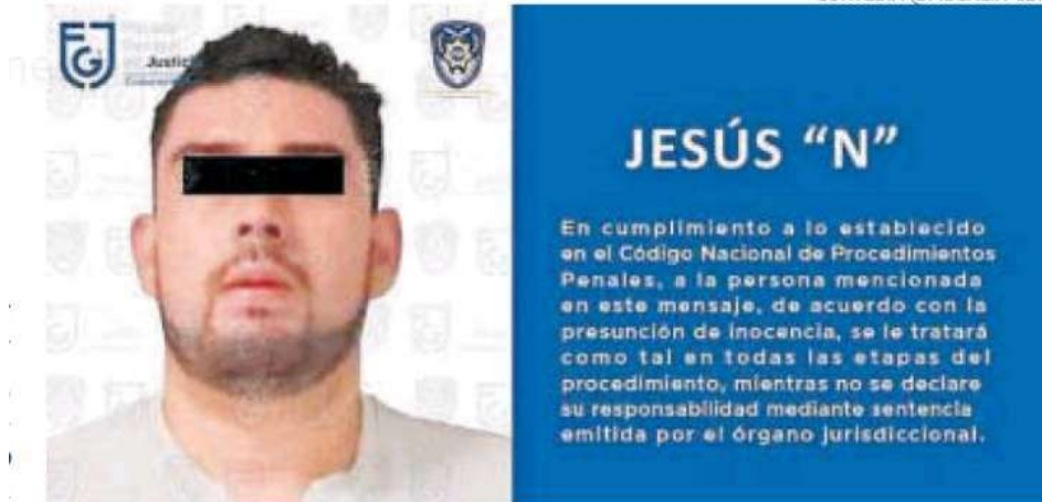
Lo atraparon en Coyoacán.