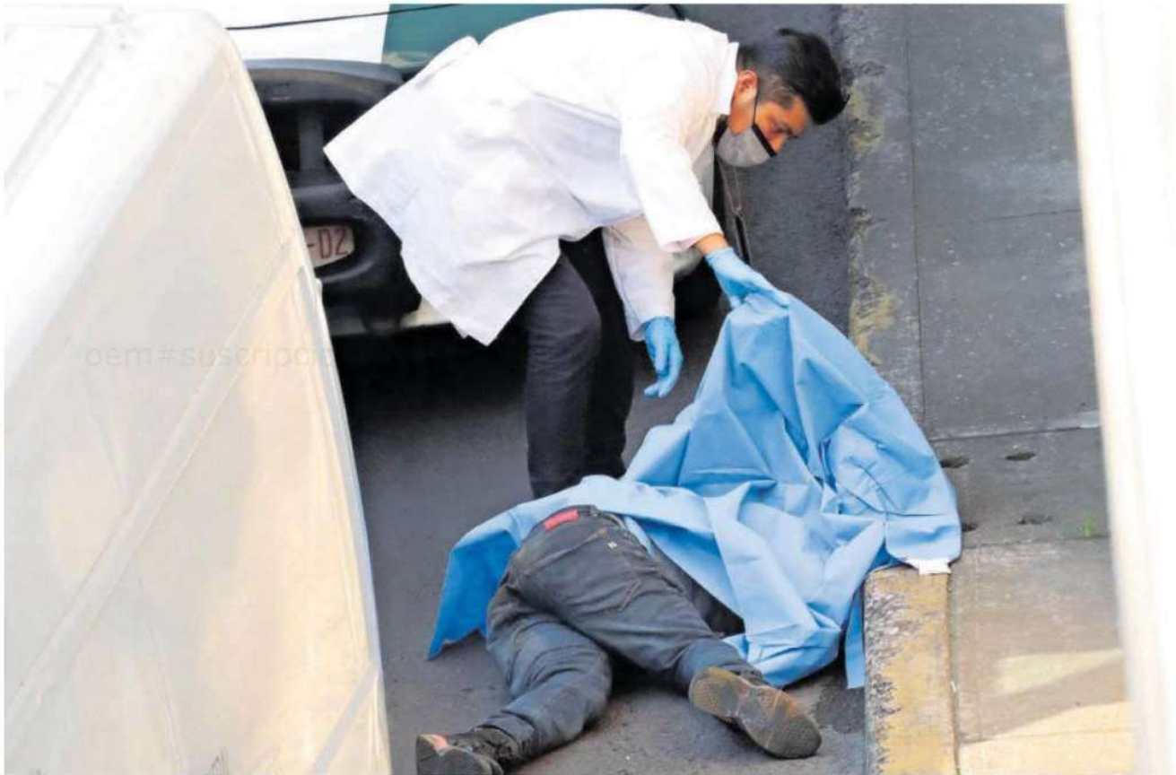
Junto al cuerpo permanecieron los vehículos que cuyos conductores aparcaron para abanderarlo