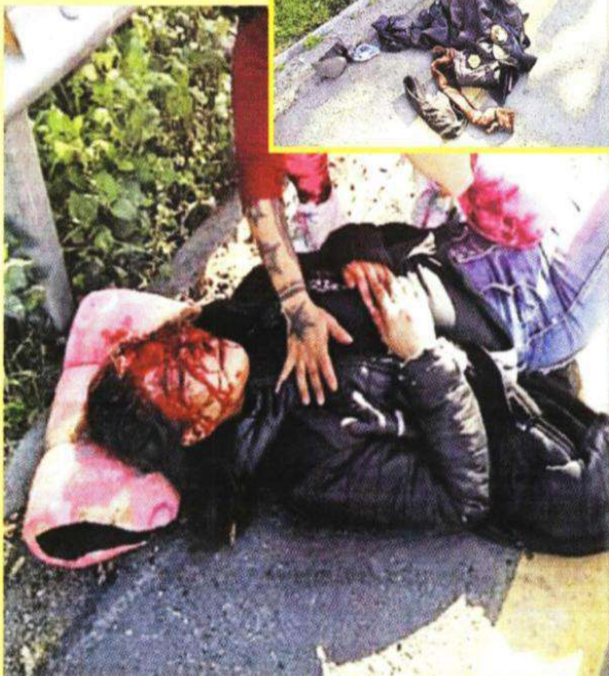
Automovilistas auxiliaron a la mujer, su uniforme policial quedó en el pavimento.

La mujer portaba el uniforme de la policía capitalina y los documentos que la acreditaban como policía adscrita al sector Roma.