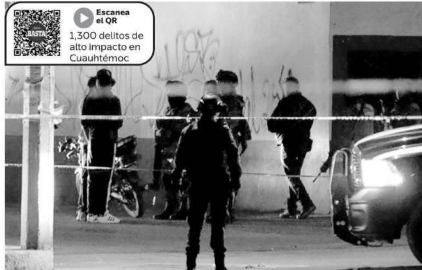
No paran homicidios, secuestros, violaciones y trata de personas

Se registraron alrededor de 19.30 ilícitos a la semana, de enero de 2022 a mayo de 2023