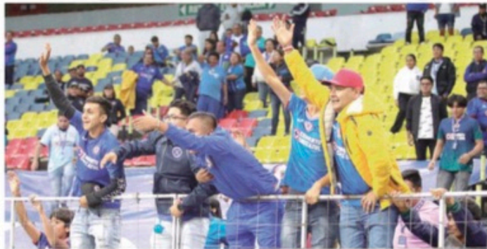
Los aficionados en busca de un boleto para el partido del próximo sábado.

La paciencia que André Jardine pidió tras