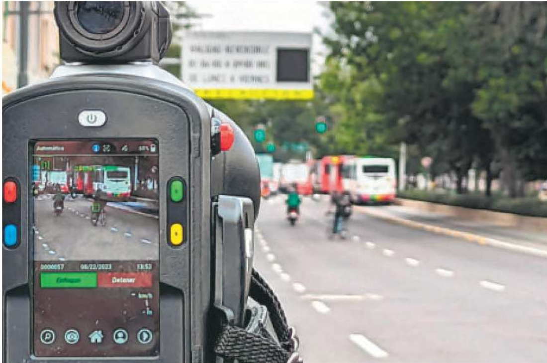
Los operativos piloto ya iniciaron en avenidas como Chapultepec y Anillo Periférico