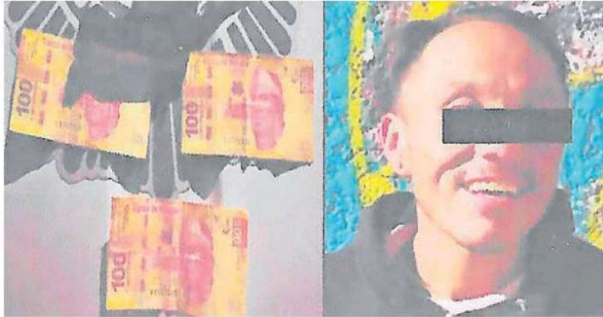
Tras una persecución, el presunto asaltante fue detenido y entre sus pertenencias se le encontraron 3 billetes de 100 pesos que había robado a mujer