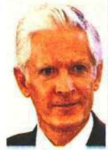
Alfredo del Mazo

::::: Pese al amparo interpuesto por la Unión Nacional de Padres de Familia y a la incertidumbre del primer día del inicio escolar 2023-2024, el gobierno del Estado de México, a cargo del priista Alfredo del Mazo , finalmente decidió distribuir los libros de texto gratuitos para más de 3 millones de estudiantes de educación básica. Luego de que el propio presidente Andrés Manuel López Obrador adelantara la posibilidad de un acuerdo con las autoridades mexiquenses, en la entidad empezó la repartición