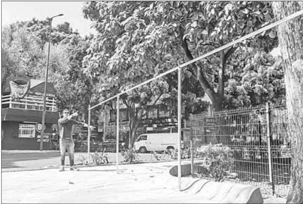
▲ En la emblemática glorieta, ante la oposición de los residentes, sólo quedaron los postes para cercar la zona de obras.