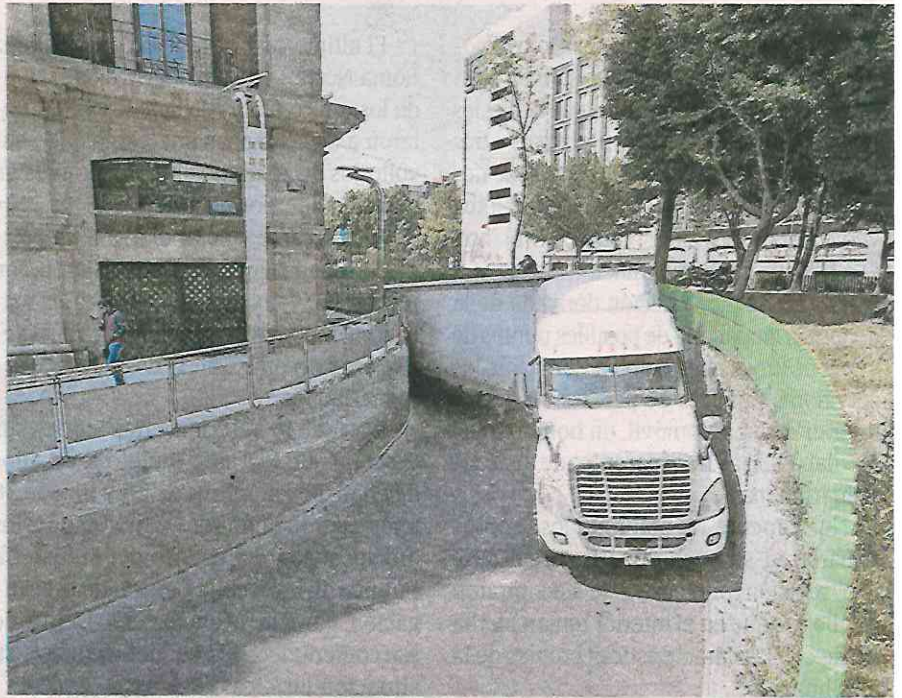
El percance provocó caos vial por espacio de una hora

La unidad fue remitida al depósito vehicular, mientras que el chofer fue presentado ante la agencia del Ministerio Público para deslindar responsabilidades.