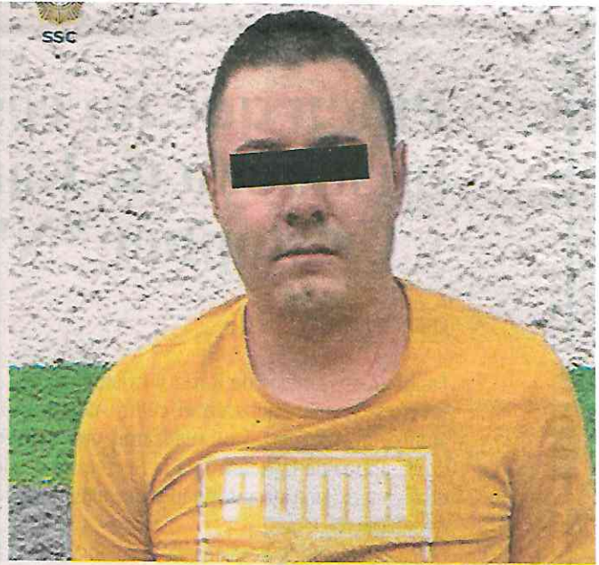
A los detenidos se les decomisó envoltorios al parecer, con marihuana