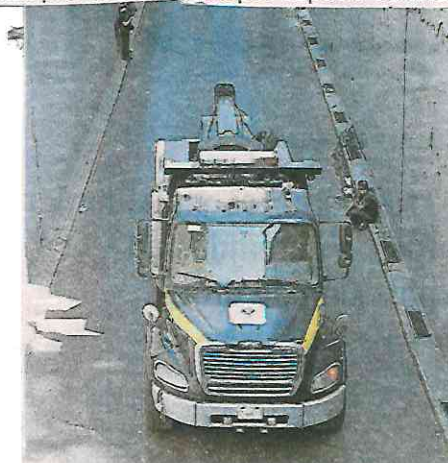
El conductor fue llevado al ministerio público para deslindar responsabilidades