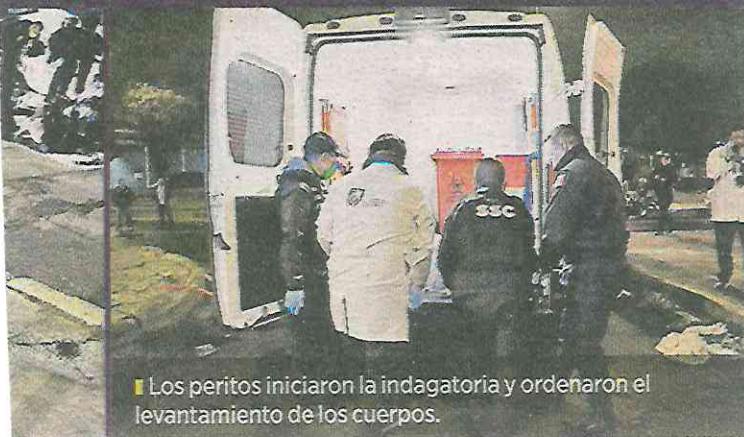
■ Los peritos iniciaron la indagatoria y ordenaron el levantamiento de los cuerpos.

Elementos de Servicios Periciales acudieron para recoger los indicios y realizar el levantamiento de los cuerpos para llevarlos a la morgue y practicarles la necropsia de rigor.