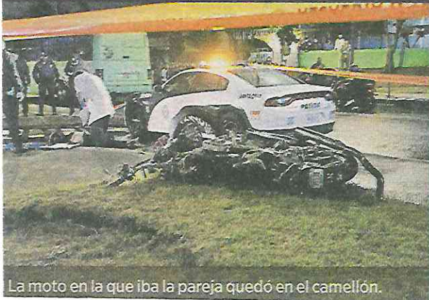
La moto en la que iba la pareja quedó en el camellón.