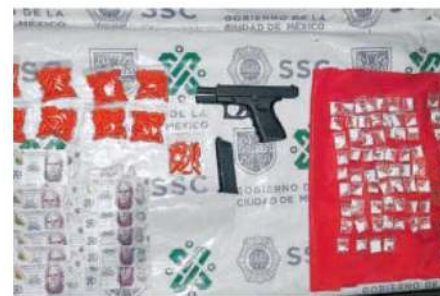
Les cayó la ley in fraganti con el gran surtido de droga