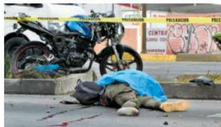
El chófer del carguero ni se inmutó por la velocidad que llevaba

Elementos de la Secretaría de Seguridad Ciudadana (SSC), llegaron al lugar de los hechos en donde observaron a un hombre tirado sobre la vía y una motocicleta desecha por lo que de inmediato solicitaron apoyo médico.