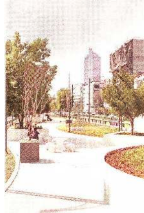
■ El parque es parte de un corredor sobre Avenida Chapultepec.

Ante la desaparición del estacionamiento, aun cuando está prohibido, empleados de la Secretaría de Seguridad Ciudadana dejan sus vehículos estacionados sobre Avenida Chapultepec.