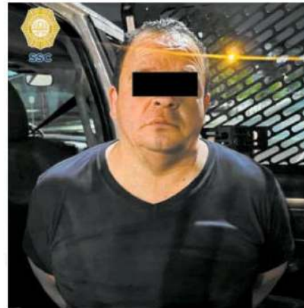
Ya investigan el proceder violento del presunto agresor

El posible responsable de 42 años de edad, fue trasladado ante el agente del MP correspondiente, quien determinará el proceso a seguir y se le considerará inocente hasta no concluir la investigación con la que se determine su situación jurídica.