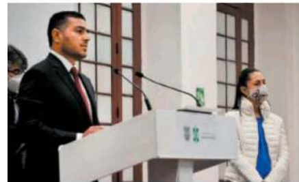
Habrà prioridad contra delitos de alto impacto

“Seguiremos combatiendo las organizaciones o las células delictivas que se encuentran en la Ciudad de México que roban, extorsionan, secuestran”, detalló.