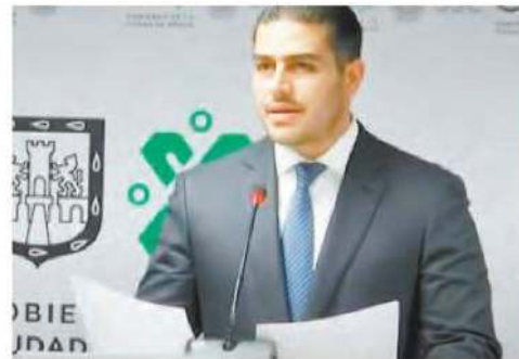
García Harfuch, en video conferencia

Dijo que sobre el robo a pasajero-conductor con violencia, al igual que en el transporte público “genera una percepción terrible a la ciudadanía”