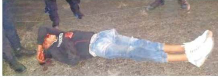
Lo dejaron como Santo Cristo