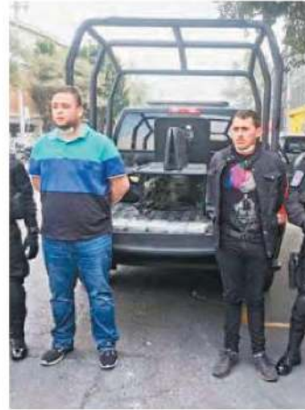
· iban bien cargados

Inmediatamente los sujetos asegurados fueron trasladados, mediante fuerte dispositivo de seguridad, a las instalaciones centrales de la Fiscalía capitalina para que rindan su declaración y expliquen su permanencia en la Ciudad de México.