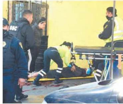
Se estaba desangrando

Mientras tanto, policías de la Secretaría de Seguridad Ciudadana (SSC) detuvieron al presunto agresor calles adelante, cuando intentaba darse a la fuga, al que trasladaron a la agencia del Ministerio Público para definir su situación jurídica.