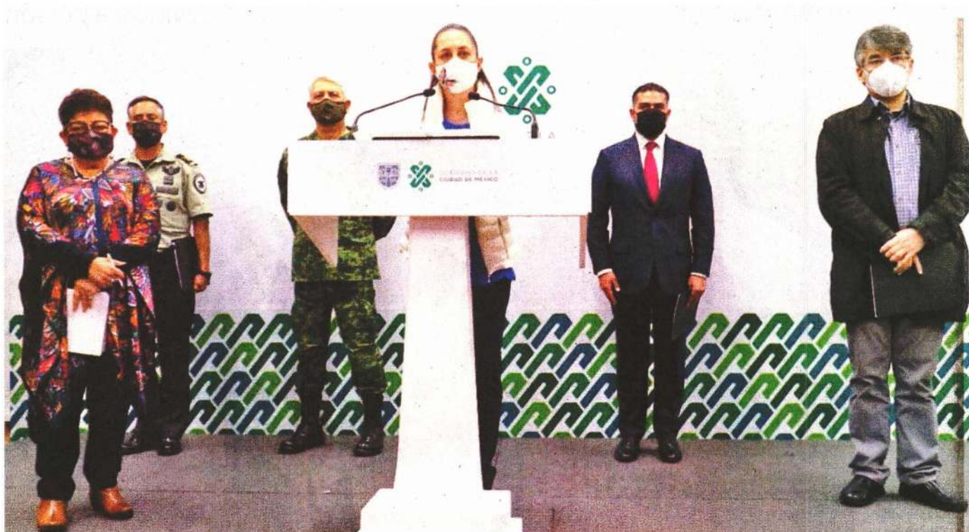
Durante la conferencia de prensa de las corporaciones de seguridad se destacó que gracias a la coordinación con las fuerzas federales y la Guardia Nacional, se han realizado 397 cateos a domicilios, con 602 personas detenidas.